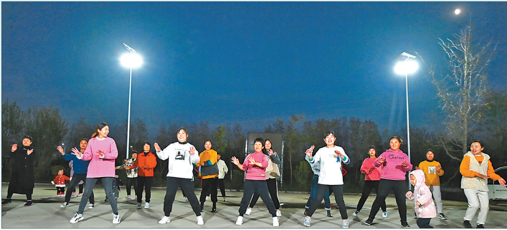
人民日报社与国家电投合作,为河北滦平、河南虞城14个行政村安装太阳能路灯,受到村民欢迎