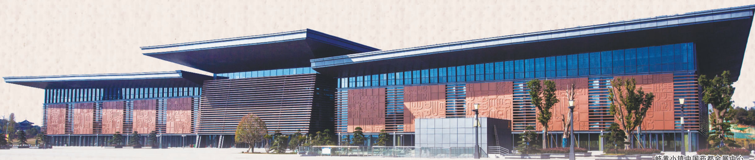
岐黄小镇中国药都会展中心

近年来,江西省樟树市围绕“振兴‘中国药都’,重振千年雄风,建设全国中医药特色城市”的奋斗目标,壮产业、延链条,形成药地、药企、药市、药会齐头并进,生产、加工、销售、科研一体化的产业化发展格局,2020年全市医药产业集群营业收入突破1000亿元。