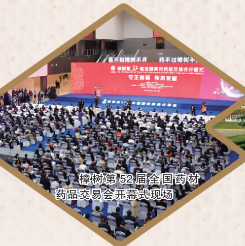
樟树第52届全国药材药品交易会开幕式现场