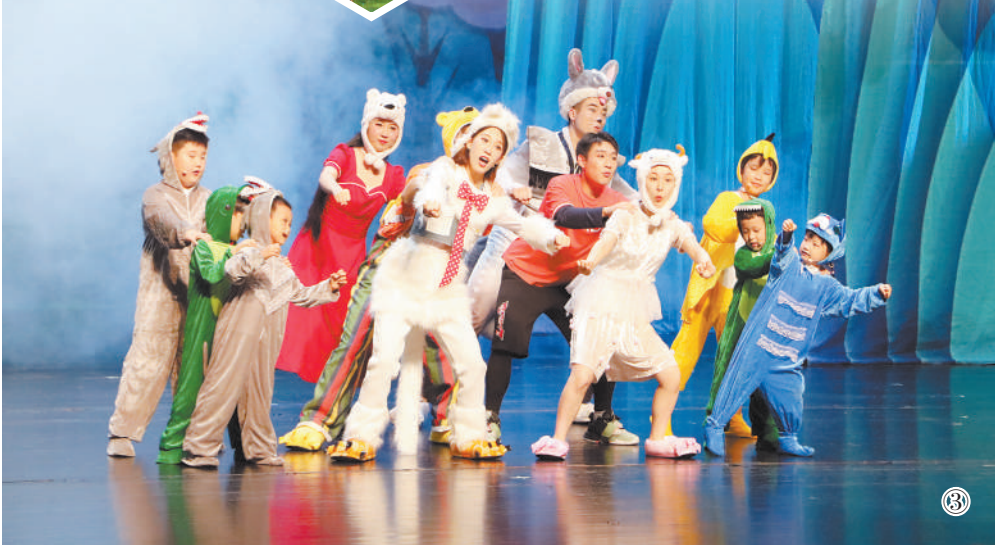
图3: 唐山大剧院演出剧照。

活”两个线上平台的第三方商户为游客提供北京环球度假区票务销售服务,购票游客将有机会获得“环球辉煌剧院”优选席位。