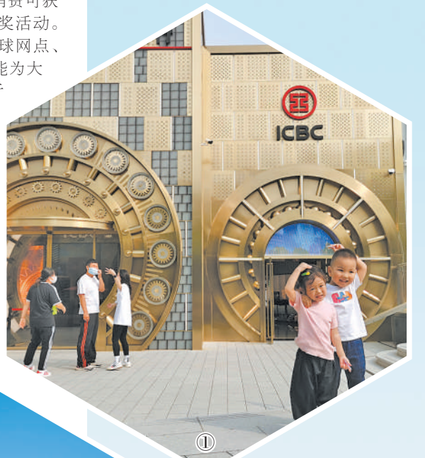
图1: 游客在工商银行位于北京环球城市大道的营业网点前留影。