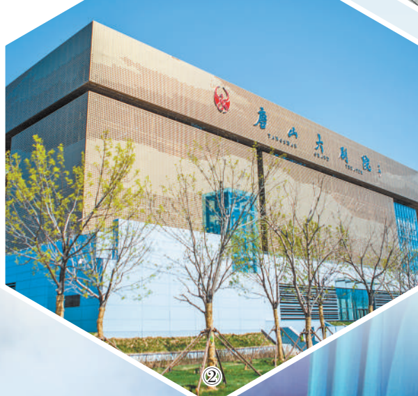
图2: 唐山大剧院外观。