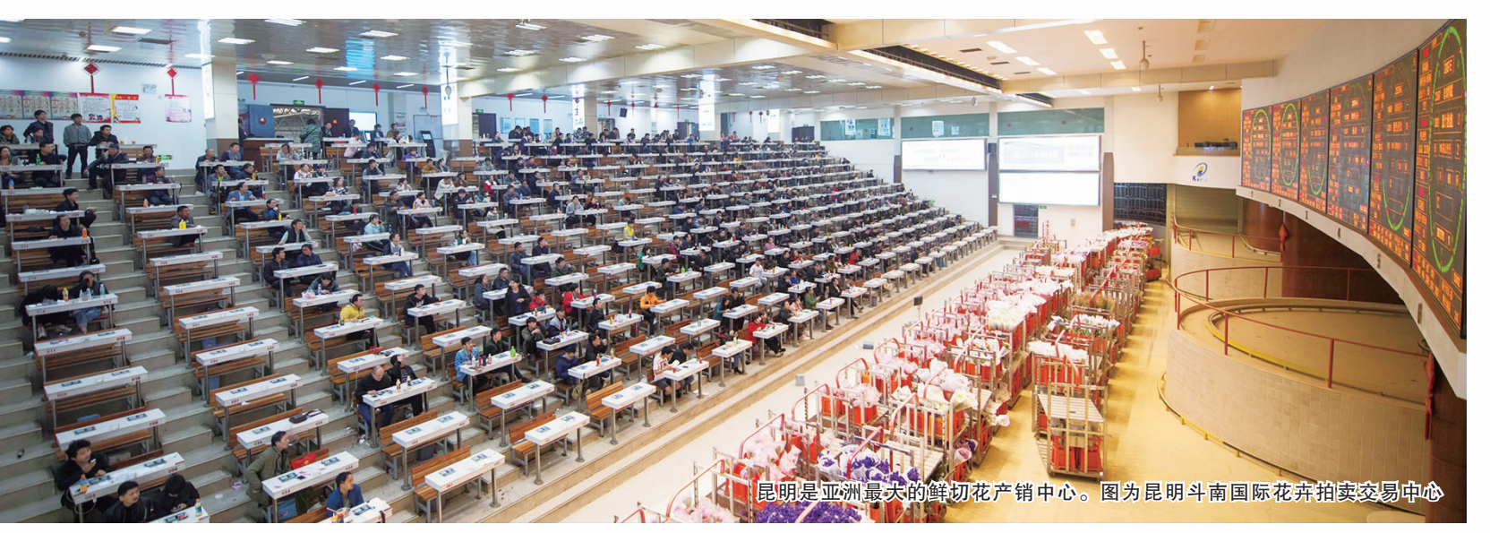
昆明是亚洲最大的鲜切花产销中心。图为昆明斗南国际花卉拍卖交易中心