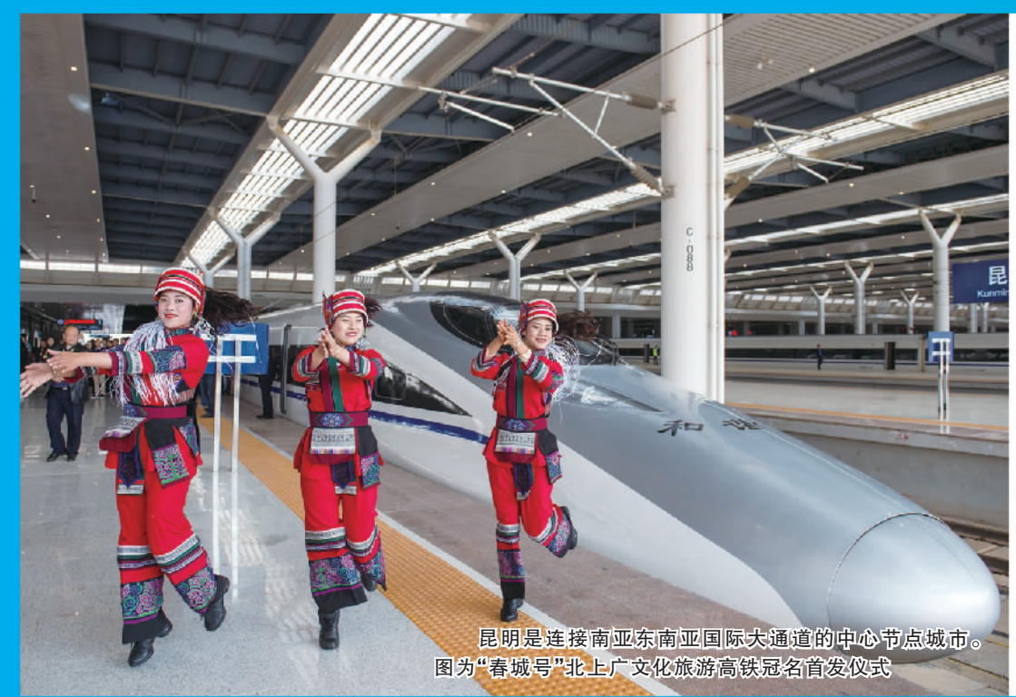
昆明是连接东南亚南亚国际大通道的中心节点城市。图为“春城号”北上广文化旅游高铁冠名首发仪式