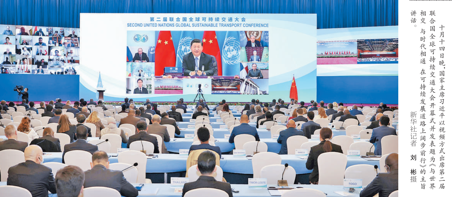
十月十四日晚,国家主席习近平以视频方式出席第二届联合国全球可持续交通大会开幕式并发表题为《与世界相向而行,在可持续发展道路上阔步前行》的主旨讲话。

新华社北京10月14日电 国家主席习近平14日晚以视频方式出席第二届联合国全球可持续交通大会开幕式并发表题为《与世界相向而行,在可持续发展道路上阔步前行》的主旨讲话。(讲话全文见第二版)习近平指出,交通是经济的脉络和文明的纽带。从古丝绸之路的驼铃帆影,到航海时代的劈波斩浪,再到现代交通网络的四通八达,交通推动经济融通、人文交流,使世界成了紧密相连的“地球村”。当前,百年变局和世纪疫情叠加,给世界经济发展和民生改善带来严重挑战。我们要顺应世界发展大势,推进全球交通合作,书写基础设施联通、贸易投资畅通、文明交融沟通的新篇章。第一,坚持开放联动,推进互联互通。要推动建设开放型世界经济,不搞歧视性、排他性规则和体系,推动经济全球化朝着更加开放、包容、普惠、平衡、共赢的方向发展。要加强基础设施“硬联通”、制度规则“软联通”,促进陆、海、天、网“四位一体”互联互通。第二,坚持共同发展,促进公平普惠。各国一起发展才是真发展,大家共同富裕才是真富裕。只有解决好发展不平衡问题,才能够为人类共同发展开辟更加广阔的前景。要发挥交通先行作用,加大对贫困地区交通投入。(下转第四版)