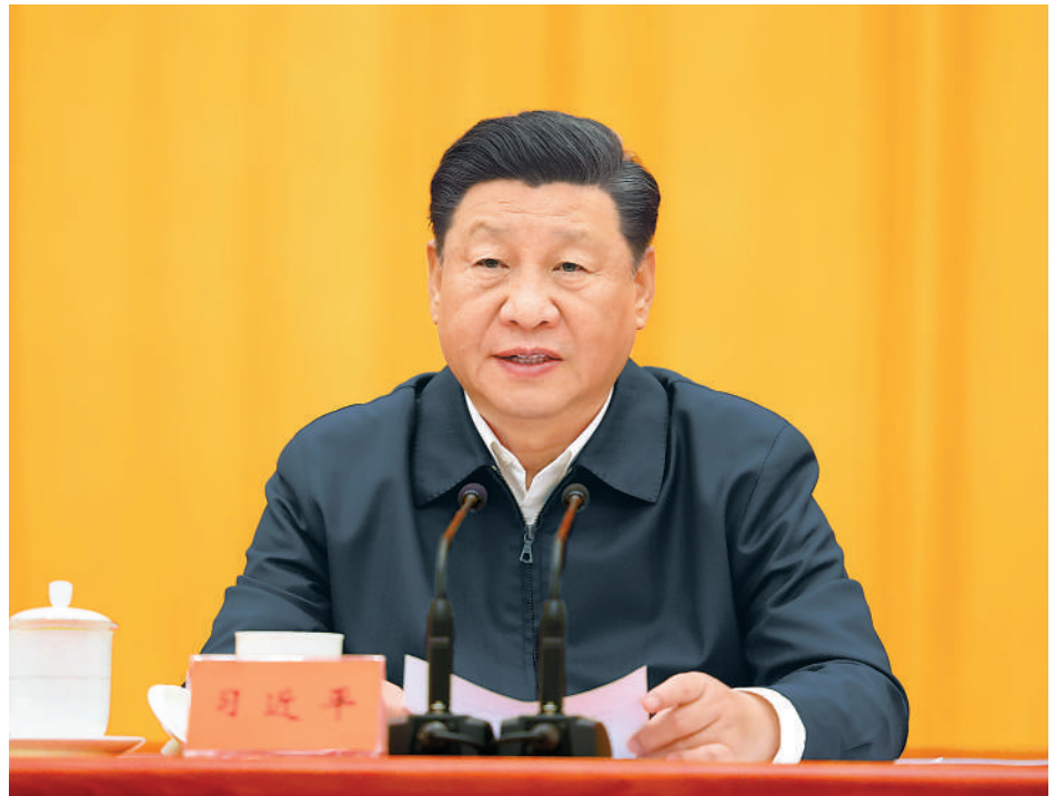
10月13日至14日,中央人大工作会议在北京召开。中共中央总书记、国家主席、中央军委主席习近平出席会议并发表重要讲话。

本报北京10月14日电 (记者徐隽)中央人大工作会议10月13日至14日在北京召开。中共中央总书记、国家主席、中央军委主席习近平出席会议并发表重要讲话,强调人民代表大会制度是符合我国国情和实际、体现社会主义国家性质、保证人民当家作主、保障实现中华民族伟大复兴的好制度,是我们党领导人民在人类政治制度史上的伟大创造,是在我国政治发展史乃至世界政治发展史上具有重大意义的全新政治制度。我们要坚持中国特色社会主义政治发展道路,坚持和完善人民代表大会制度,加强和改进新时代人大工作,不断发展全过程人民民主,巩固和发展生动活泼、安定团结的政治局面。中共中央政治局常委李克强、汪洋、王沪宁、赵乐际、韩正,国家副主席王岐山出席会议。习近平在讲话中指出,人民代表大会制度,坚持中国共产党领导,坚持马克思主义国家学说的基本原则,适应人民民主专政的国体,有效保证国家沿着社会主义道路前进。人民代表大会制度,坚持国家一切权力属于人民,最大限度保障人民当家作主,把党的领导、人民当家作主、依法治国有机结合起来,有效保证国家治理跳出治乱兴衰的历史周期率。60多年来特别是改革开放40多年来,人民代表大会制度为党领导人民创造经济快速发展奇迹和社会长期稳定奇迹提供了重要制度保障。习近平强调,党的十八大以来,党中央统筹中华民族伟大复兴战略全局和世界百年未有之大变局,从坚持和完善党的领导、巩固中国特色社会主义制度的战略全局出发,继续推进人民代表大会制度理论和实践创新,提出一系列新理念新思想新要求,强调必须坚持中国共产党领导,必须坚持用制度体系保障人民当家作主,必须坚持全面依法治国,必须坚持民主集中制,必须坚持中国特色社会主义政治发展道路,必须坚持推进国家治理体系和治理能力现代化。