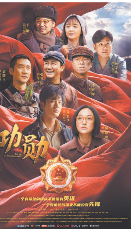
图为电视剧《功勋》海报。

经过两年的创作打磨，电视剧《功勋》在今年国庆节前与观众见面了。《功勋》的主旨，是将首批8位“共和国勋章”获得者的人生华彩篇章与新中国奋斗史联系起来，诠释他们“忠诚、执着、朴实”的人生品格和献身祖国服务人民的崇高境界。