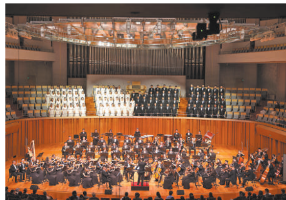
大型交响合唱组曲《南梁颂》首演剧照。