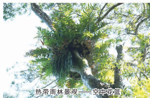
热带雨林景观——空中花篮