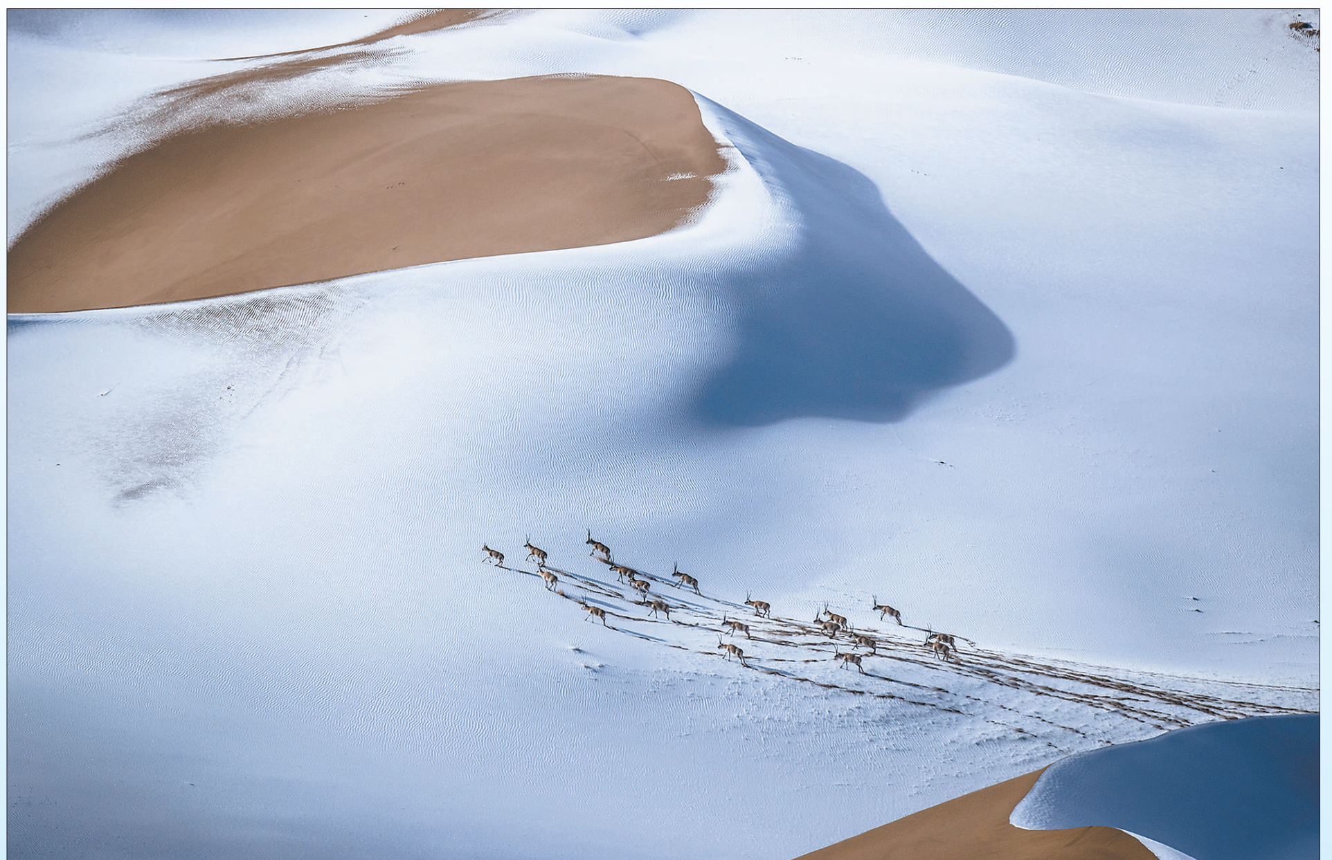
图①:青海省曲麻莱县215国道旁,藏野驴奔跑嬉戏。本报记者 雷声摄 图②:青海省杂多县昂赛乡,国家一级保护动物雪豹在山上休息。鲍永清摄(人民视觉) 图③:国家二级保护动物藏狐宝宝在玩耍。鲍永清摄(人民视觉) 图④:三江源国家公园管理局长江源园区管委会可可西里管理处索南达杰保护站站长赵新录在喂养受伤的藏羚羊羔。人民视觉 图⑤:白雪皑皑的昆仑山玉虚峰下成群的藏羚羊。樊尚珍摄(人民视觉) 图⑥:青海玉树隆宝滩的喜马拉雅旱獭。本报记者 雷声摄 图⑦:藏羚羊在昆仑山深处的库木库里沙漠穿行。李善元摄(人民视觉)