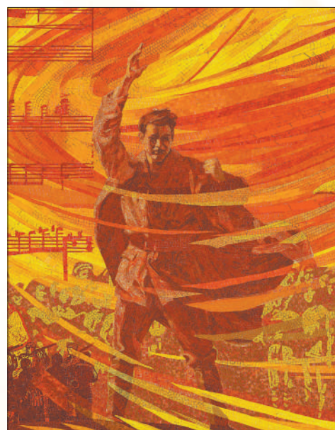
延安文艺纪念馆马赛克镶嵌壁画《延安文艺 永恒华章》局部,作者范迪安、白晓刚。

光,为下埔村注入发展新动能。一些乡村,用壁画讲述党的伟大历程,镌刻红色精神。进入中国工农红军第九军诞生地——河南省平顶山市叶县桐树庄村,铺满全村墙面的红色壁画引人注目。沿着街道走去,中共一大会议、秋收起义、井冈山会师、万里长征……党史上的重大事件,一一呈现于墙面,它们与村中的红军纪念碑遥相呼应,让红色故事更加深入人心。不只在村里,在入村高速公路两旁、乡镇的红色文化园内,红色壁画随处可见,表现形式也从平面转向立体,以极富