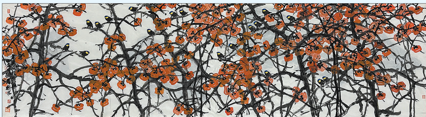
硕果累累(中国画) 马新林