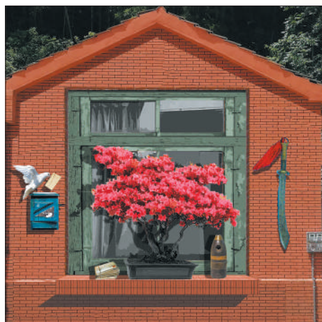
安徽省六安市霍山县岳佛庵镇丙坊壁画《窗前的杜鹃花》,中国美术学院绘画艺术学院师生集体创作。

画装饰街道、传播红色文化,成为一种热潮。一些乡村,深挖地域红色资源,将其融入生态文明建设之中,绘出一幅幅美丽乡村画卷。被评为广东省“红色村”党建工程示范点的陆丰市下埔村就是一个生动的例子。下埔村有着深厚的红色历史。这里不仅是海陆丰农民运动的活跃地区之一,还保留着不少革命家故居、革命活动旧址。这些红色文化遗产,为下埔村的小康生活增添了一抹亮丽的色彩。如今,在一幢幢民居上,一幅幅富有地域特色的红色壁画,无声地讲述着这里动人的革命故事。它们连同金鼎红色文化馆、党建广场、榕树公园等串起一条红色旅游线,吸引着各地游客前来观