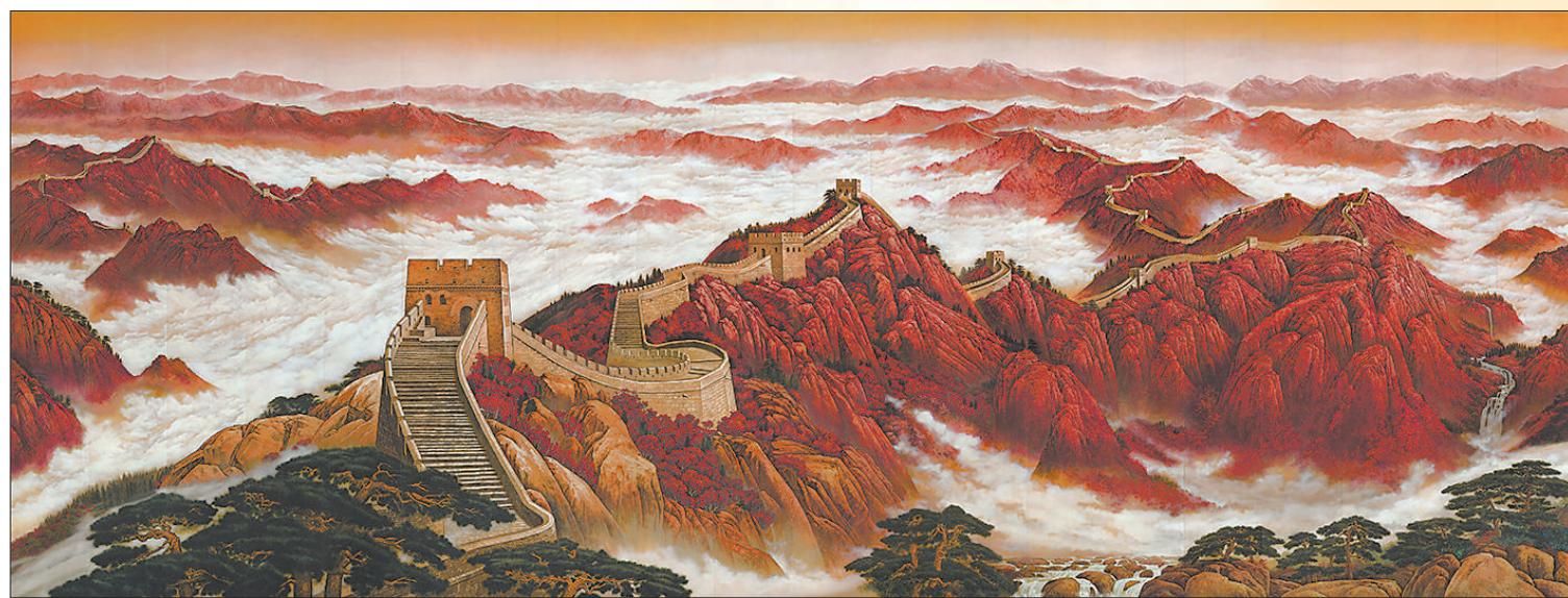
▲中国共产党历史展览馆壁画《长城颂》,作者程向军。