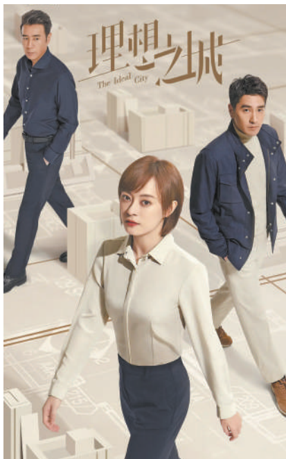
图为电视剧《理想之城》剧照。