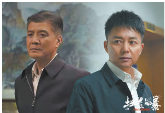
图为电视剧《扫黑风暴》剧照。

现实题材创作的源头在现实,力量在真实。聚焦“国计民生”、聚焦时代变化,现实题材剧总能找到好故事。而好故事不但要吸引人,更要启迪人、鼓舞人、引领人。用光明驱散黑暗,用美善战胜丑恶,让人们看到美好、看到希望、看到梦想就在前方,应是现实题材创作的宗旨。现实题材剧创作面临挑战,突破难点必成亮点。如何更准地把脉大众关切并厘清问题实质,如何更稳地寻求破解难题的可行路径,是现实题材剧创作应当探索的命题。