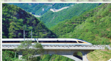
京张高铁复兴号智能动车组行驶在长城脚下