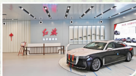
红旗工厂总装车间展厅