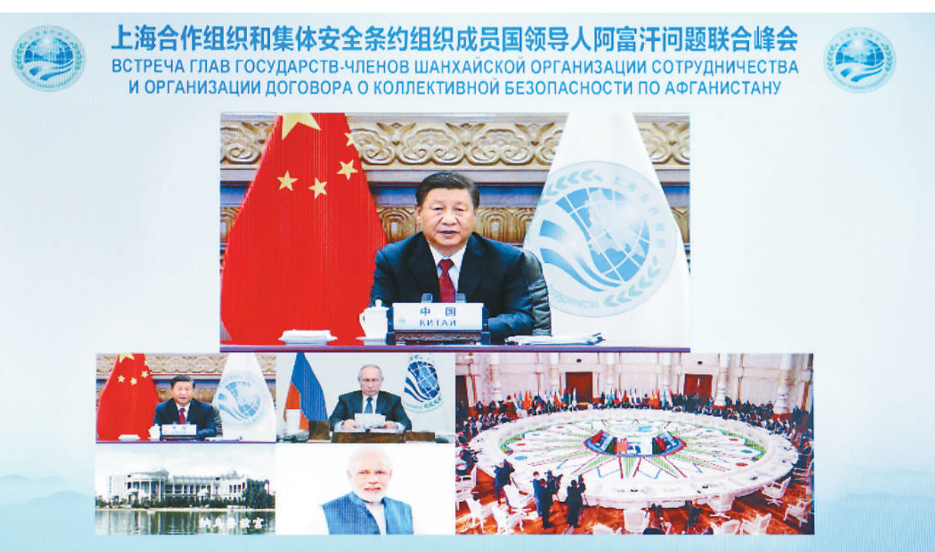
9月17日,国家主席习近平在北京以视频方式出席上海合作组织和集体安全条约组织成员国领导人阿富汗问题联合峰会并发表重要讲话。

新华社北京9月17日电 国家主席习近平17日下午在北京以视频方式出席上海合作组织和集体安全条约组织成员国领导人阿富汗问题联合峰会并发表重要讲话。 习近平指出,近期,阿富汗局势发生根本性变化,对国际形势、地区格局和安全稳定产生重要影响。目前,阿富汗面临不少困难和挑战,尽快恢复正常秩序,实现局势软着陆,是全体阿富汗人民的紧急要务,国际社会和地区国家也需要密切关注。上海合作组织和集体安全条约组织成员国都是阿富汗