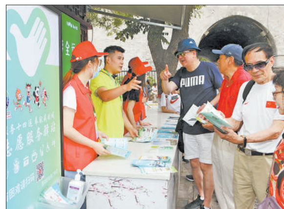
青年志愿者为游客介绍北院门风情街美食和旅游景点。

一汪好水，点绿一座大山，养出一方人文。在秦岭北麓，青山绵延，锦绣堆翠，水环环绕，蔬圃稻畦。一村一落是美景，一山一水总关情。