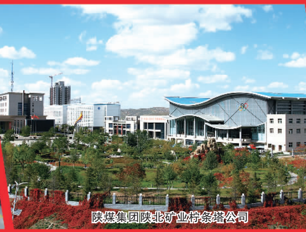
陕煤集团陕北矿业塔梁塔公司