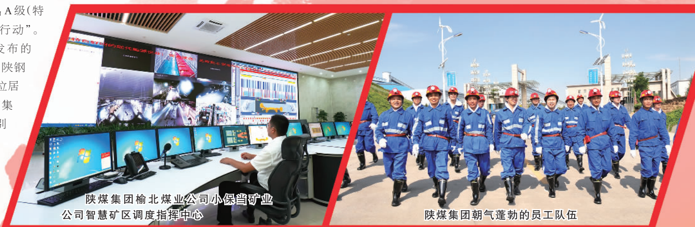
陕煤集团榆北煤业公司小保当矿业公司智慧矿区调度指挥中心