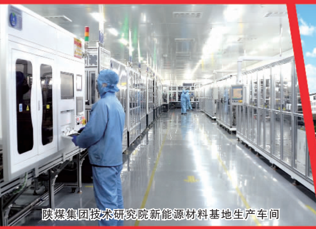
陕煤集团技术研究院新能源材料基地生产车间