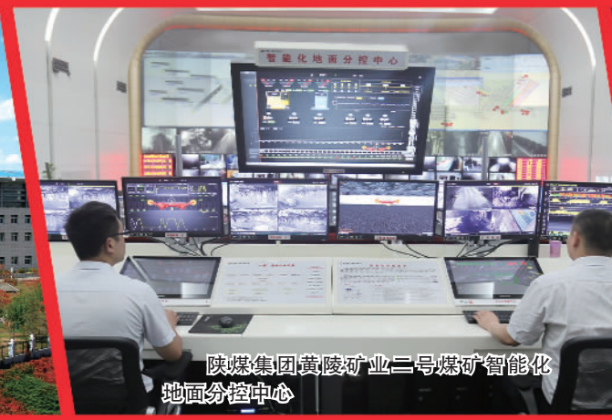
陕煤集团黄陵矿业二号煤矿智能化地面分控中心