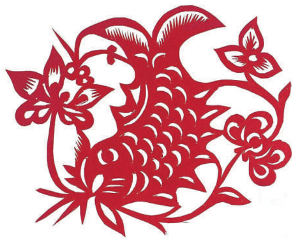
▼中华艺术宫藏高金爱剪纸《鱼戏莲》。

于传统中探索总结剪纸艺术规律、思想内涵,立足现代生活进行守正创新,是值得剪纸创作者不断追求的方向和目标。(作者为南京大学文化与自然遗产研究所副所长)