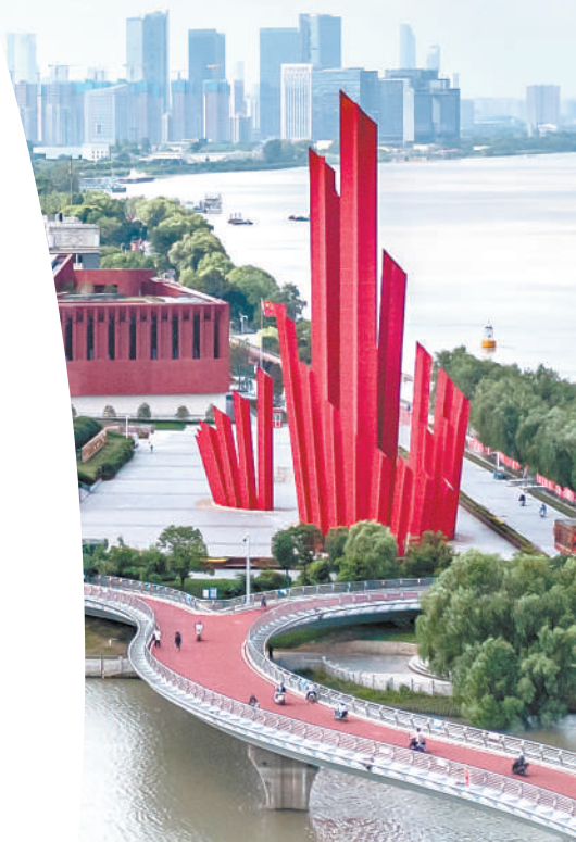
▲渡江胜利纪念馆广场上的群雕“千帆竞渡”。