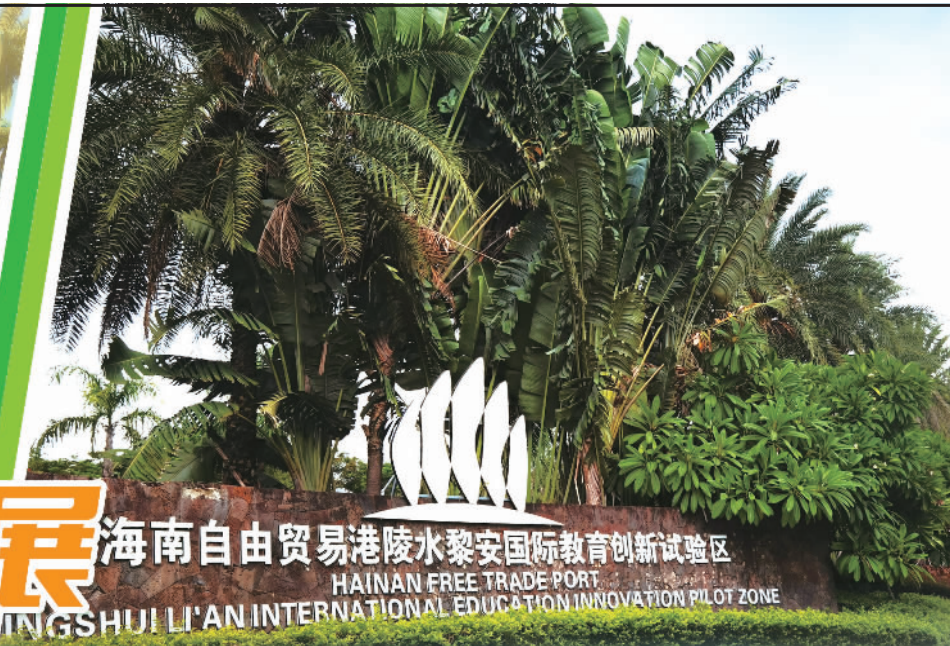
海南自由贸易港陵水黎安国际教育创新试验区 HAINAN FREE TRADE PORT LINGSHUI LI'AN INTERNATIONAL EDUCATION INNOVATION PILOT ZONE

从高空俯瞰,陵水黎族自治县呈现一幅生机盎然的滨海生态美景图。“三湾三岛两湖一山一水”(香水湾、清水湾、土福湾,分界洲岛、南湾猴岛、椰子岛,新村潟湖、黎安潟湖,吊罗山,高峰温泉)铺展开来,如连串的珍珠排列在蜿蜒漫长的海岸线上,让“珍珠海岸·美丽陵水”美誉名不虚传。