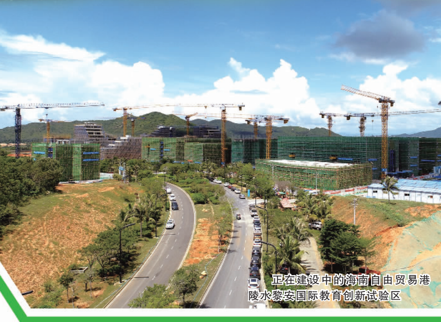
正在建设中的海南自由贸易港陵水黎安国际教育创新试验区

做好海南陵水黎安国际教育创新试验区、健康养生产业两篇文章,陵水提出打造“留学陵水”“康养陵水”品牌。同时,充分发挥40多年南繁育种经验及全国15个省份近200家科研单位在陵水育种的优势,服务