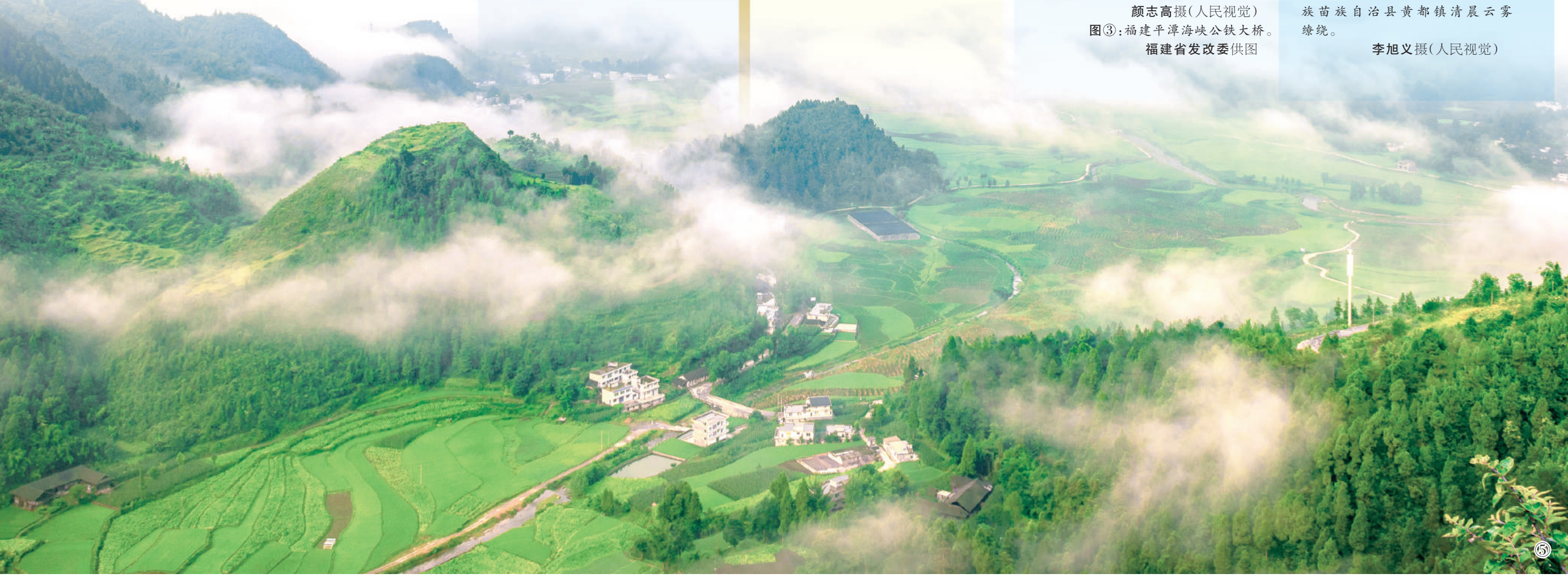
图④：海南三亚蜈支洲岛海域海洋牧场。 图⑤：贵州省遵义市务川仡佬族苗族自治县黄都镇清晨云雾缭绕。