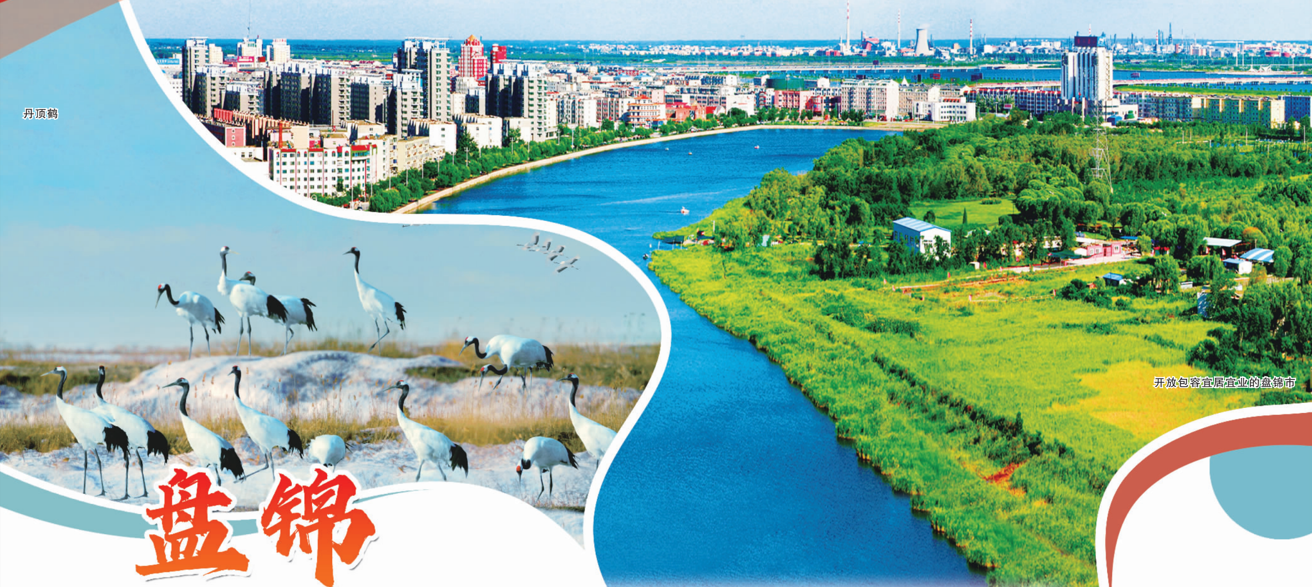
开放包容宜居宜业的盘锦市