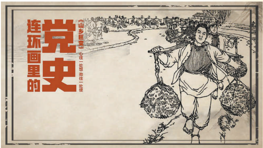
▲央视视频《连环画里的党史》之《山乡巨变》专题海报。