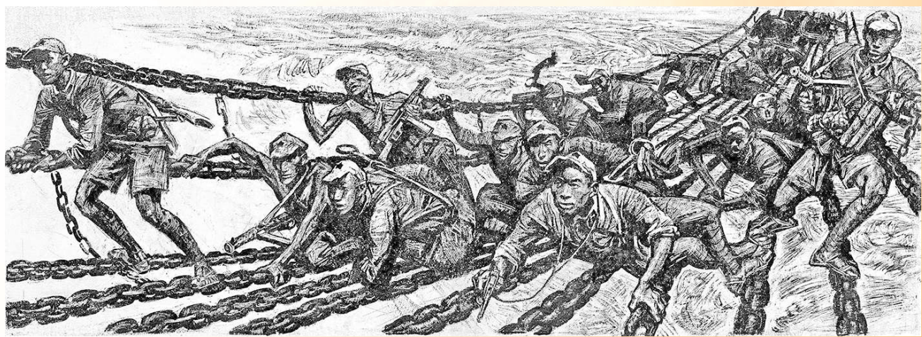
◀《日出东方：庆祝中国共产党成立一百周年连环画专辑》。