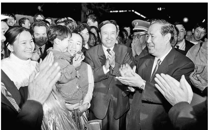
1995年10月2日，姜春云等同志同参加新疆维吾尔自治区成立40周年庆祝活动的乌鲁木齐市市民亲切交谈。