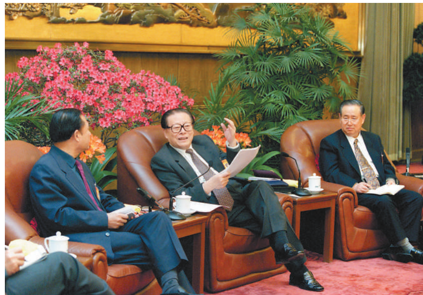
2000年3月13日，江泽民同志和姜春云同志在北京人民大会堂参加九届全国人大三次会议吉林代表团讨论。