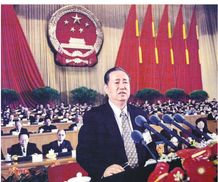
一九九九年三月九日，姜春云同志在九届全国人大二次会议上作全国人大常委会工作报告。