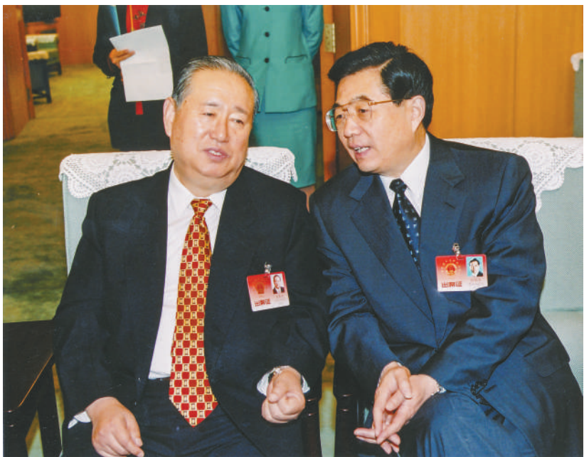
2002年3月，九届全国人大五次会议期间，胡锦涛同志与姜春云同志交谈。