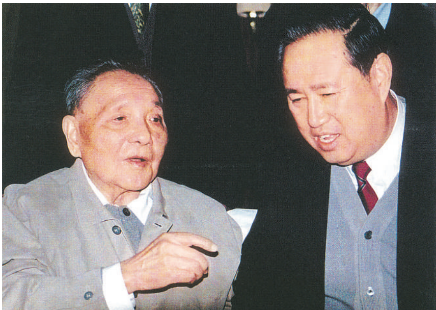
1993年12月9日，邓小平同志在济南听取姜春云同志汇报山东省经济社会发展情况。