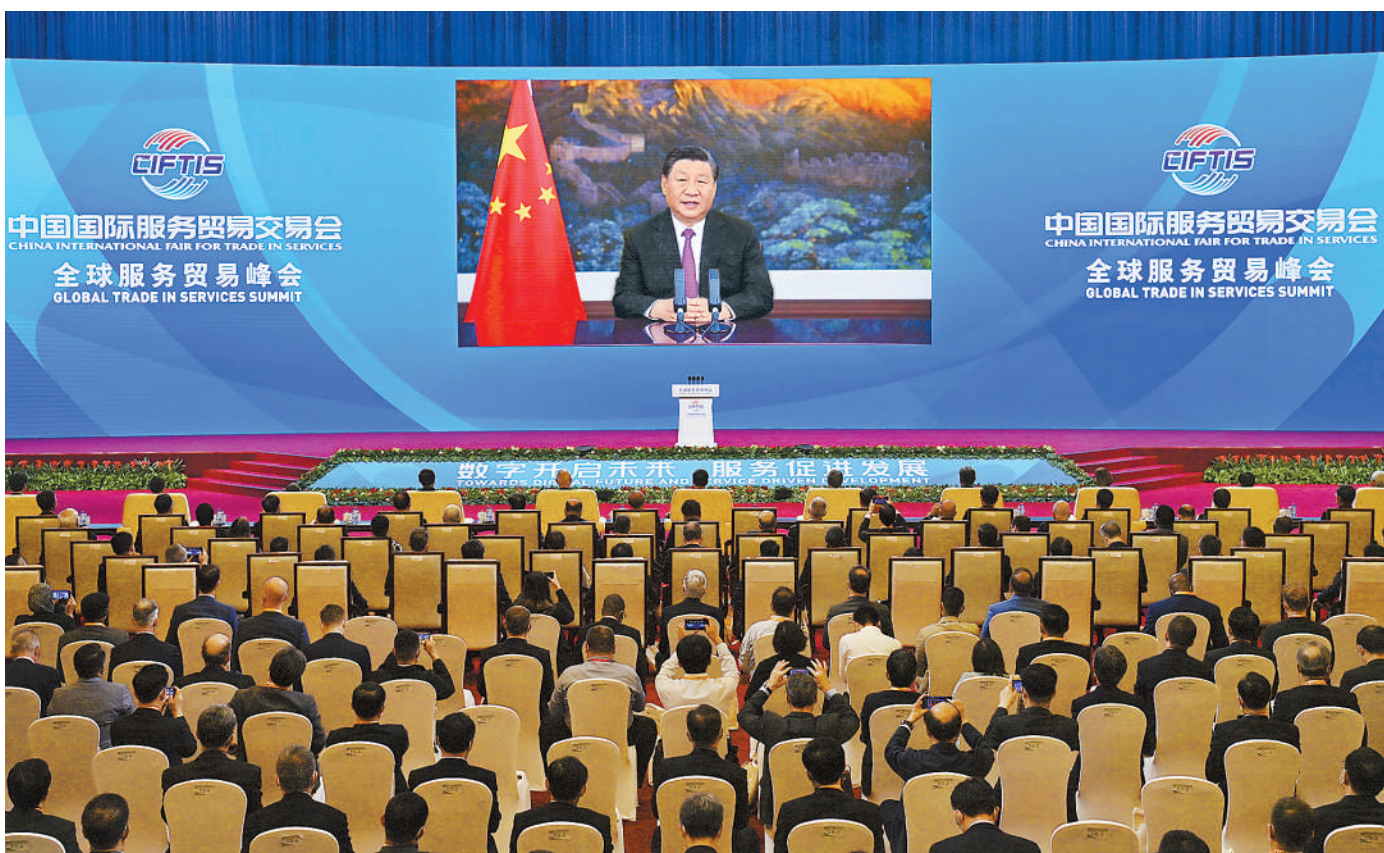
9月2日晚,国家主席习近平在2021年中国国际服务贸易交易会全球服务贸易峰会上发表视频致辞。新华社记者 岳月伟摄