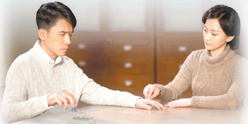
图为电影《听风者》剧照。

文学的创新是要在已有的现实中敞开心扉的写作可能性,而这种可能性就蕴藏在我们伟大的时代和悠久的传统里。讲好中国故事,归根到底是要讲好中国人的故事,让世界听得到时代的脚步声