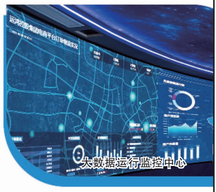
大数据运行监控中心