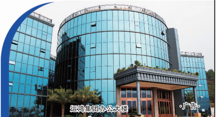
运鸿集团办公大楼