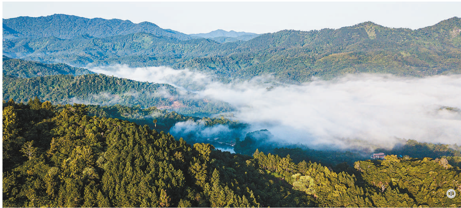
海南保护天然底色,推动绿色发展

开展国家公园体制试点,大力推广装配式建筑……海南不断擦亮生态名片,多措并举推动生态保护。