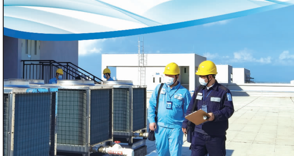
南方电网广东东莞南区供电局工作人员到企业检查电能替代项目设备组件运行情况