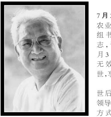
新华社北京7月23日电 原农业部副部长、党组书记何康同志，于2021年7月3日因病医治无效在北京逝世，享年99岁。

张左己是中共第十六届、十七届中央委员会委员，在党的十五大当选为中央纪委委员。政协第十一届全国委员会常务委员、经济委员会主任；政协第十二届全国委员会常务委员。