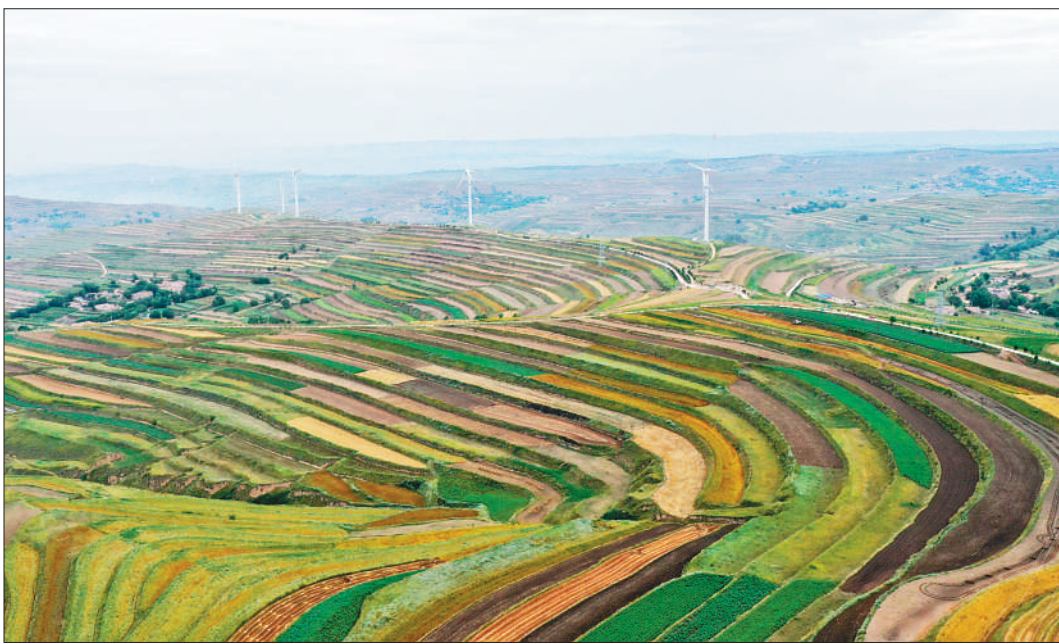
在位于甘肃省定西市通渭县的华家岭，层层梯田线条分明，与高耸的风力发电机构成别致的风景。图为日前华家岭的梯田与风电机组。

老党员达约在巡边放牧路上坚守了34年。他每到一个个山顶，都用鹅卵石拼出醒目的“中国”