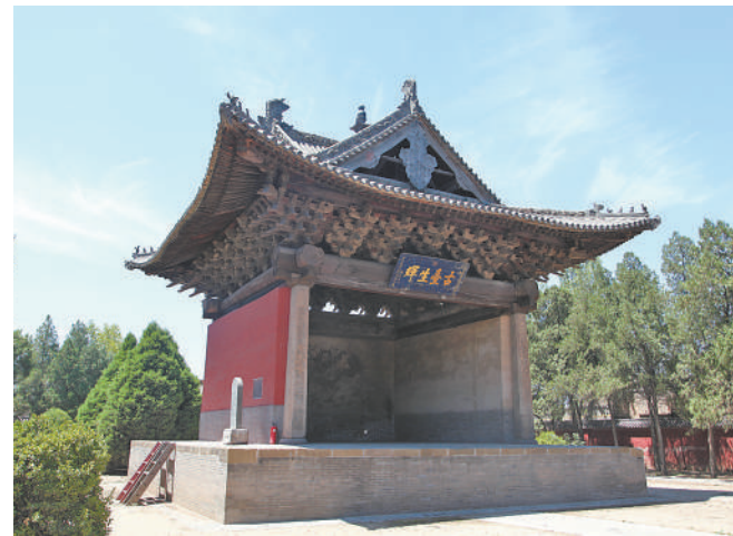
临汾东羊后土庙元代一面观戏台。

我国戏曲成熟于北宋时期,为了适应演员表演和观众听闻的需要,宋元戏台的形制结构经历了从露台到四面观、大三面观、小三面观和一面观的变化。那么,这些形制变化的原因、逻辑和结果是什么?不同时期的改进与人们的审美、科技发展、经济繁荣是否有关呢?