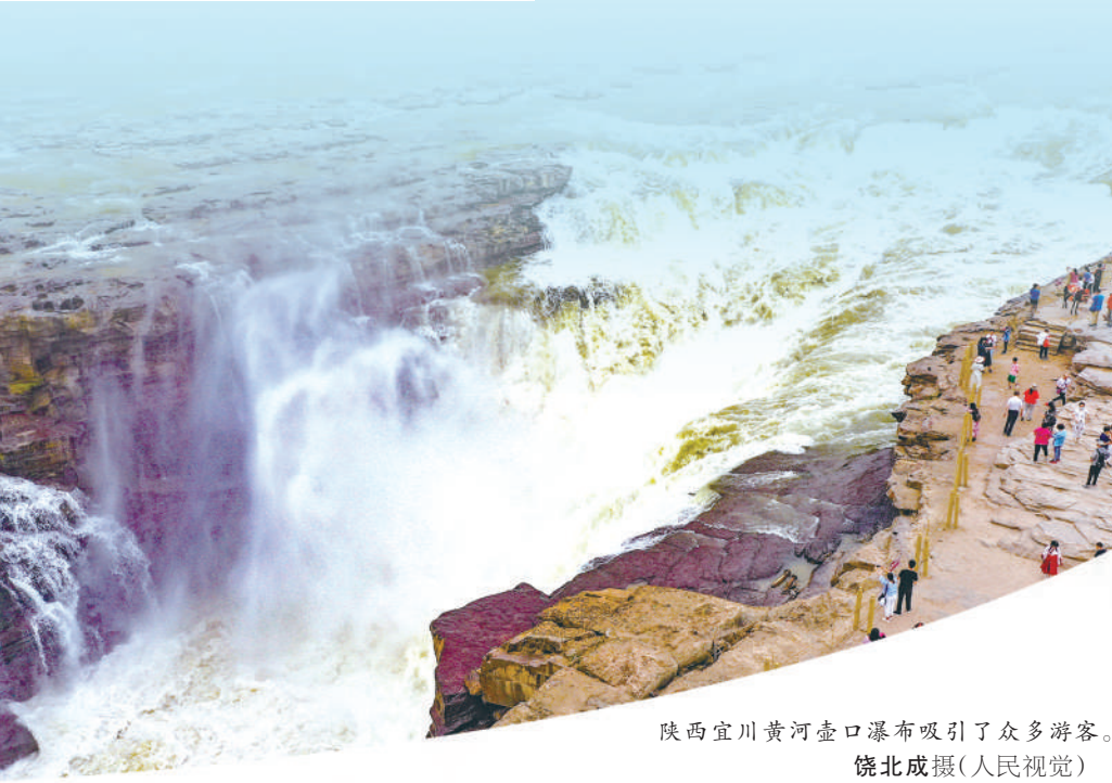
陕西宜川黄河壶口瀑布吸引了众多游客。