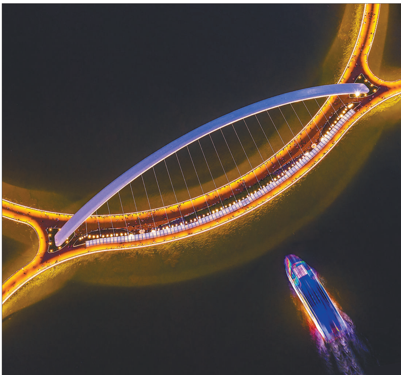
海心桥是广州首座跨珠江人行桥,北起二沙岛,南至广州塔,横跨珠江两岸,全长488米,主拱拱跨198米,桥面最大宽度15米。图为8月11日晚,美丽的海心桥夜景。

以特色产业助力乡村振兴,近年来,河北持续打造“一村一品”“一乡一业”,支持每个脱贫县因地制宜发展壮大1至2个农业特色产业。目前,已在全省脱贫地区建设设施蔬菜、特色杂粮、中药材、板栗、优质苹果等多个特色产业带,形成了平泉香菇、临城核桃、围场马铃薯、迁西板栗、深州蜜桃等一批独具特色的乡村致富产业,有效带动了当地群众持续增收。