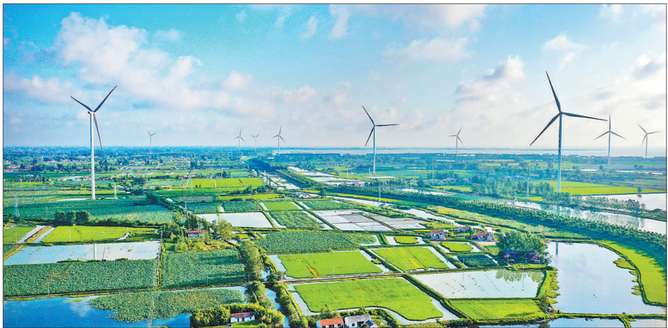
近年来，我国可再生能源装机规模持续扩大，各地推动能源清洁低碳安全高效利用，促进经济社会发展全面绿色转型。江苏省淮安市金湖县利用当地丰富的自然资源，践行绿色发展理念，大力发展新能源，优化能源结构，实现资源效益叠加。截至今年7月底，金湖县新能源装机容量79.38万千瓦。图为金湖县塔集镇的风车与田园风光。

“广西将充分发挥‘一湾相挽十一国，良性互动东中西’的独特区位优势，以西部陆海新通道建设为牵引，加快中国（广西）自贸试验区、面向东盟的金融开放门户、中国—东盟信息港、防城港国际医学开放试验区等平台建设，精心办好中国—东盟博览会和商务与投资峰会等重大活动，加快发展开放型经济，在‘一带一路’建设中发挥独特作用。”广西壮族自冶区党委主要负责同志说。