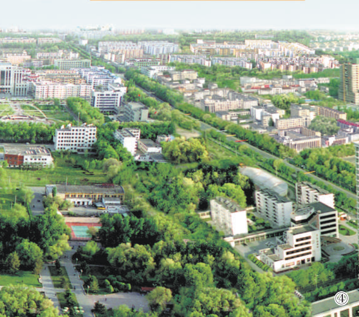
图①：新疆兵团军垦博物馆外景。 资料图片 图②：第四师可克达拉大桥。 马应林摄 图③：石河子屯垦戍边纪念碑。 资料图片 图④：第八师石河子市鸟瞰图。 王建军摄