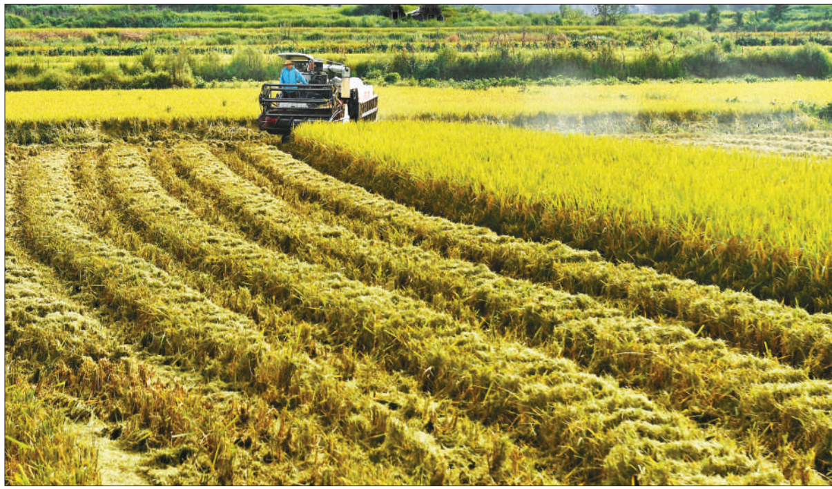
8月10日，四川省邻水县九龙镇七星村，江苏稻客驾驶收割机抢收稻谷。秋收时节，四川水稻进入收割季，江苏、河南、安徽等地稻客及时入川，帮助当地农民抢收稻谷。

通知要求，加强人员管控，确保实现闭环管理。对在隔离病区工作的，包括医务人员、管理人员、安保、后勤（含餐饮、医疗废物收集转运等人员）、保洁以及通勤车辆司机等在内的所有人员，在首次进入隔离病区前均应当完成新冠病毒疫苗全程接种，并由当地政府安排驻地，实施统一闭环管理。隔离病区工作结束后返回其他病区工作前，应当按照规定做好隔离观察和核酸检测等工作。