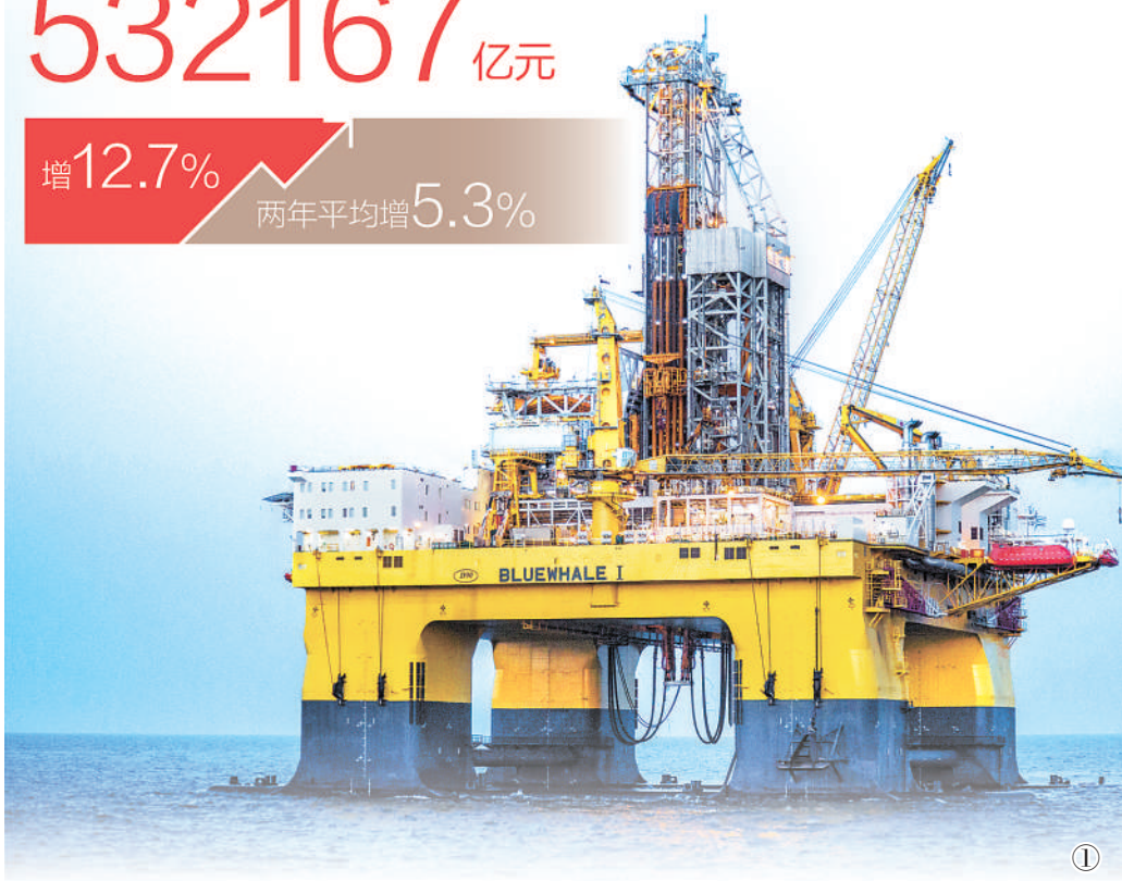
巩固统筹疫情防控和经济社会发展工作的成果。

以创新增强发展活力,强化科技创新和产业链供应链韧性。郭丽岩分析,上半年,我国在增强产业链供应链自主可控能力、以创新强链补链方面,展现出更充足的动力。“上半年,规模以上高技术制造业增加值两年平均增长13.2%,比一季度加快0.9个百分点;工业机器人、集成电路产量分别增长69.8%和48.1%,体现出我们在突破产业链瓶颈和促进高技术应用等方面取得阶段性成效。”