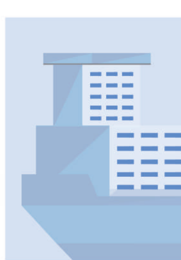
本期统筹:白之羽 责任编辑:林琳 吕中正 韩春瑶 版式设计:张丹峰

现在,码头作业区每天船来船往,一片繁忙景象。“下半年,我们将继续提升港口作业效率,以保障货物顺利进出口,提升客户体验。”张品说,通过努力,有信心完成全年任务目标。