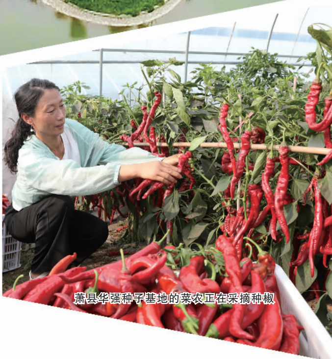
萧县华强种子基地的菜农正在采摘辣椒