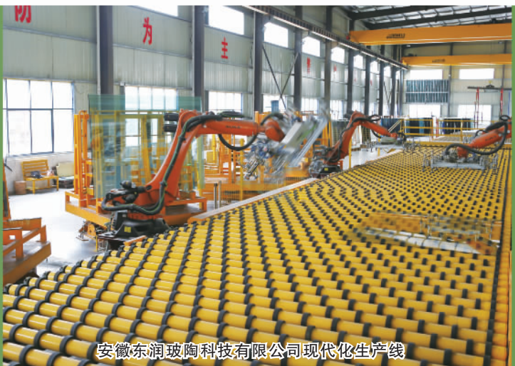
安徽东润玻璃科技有限公司现代化生产线