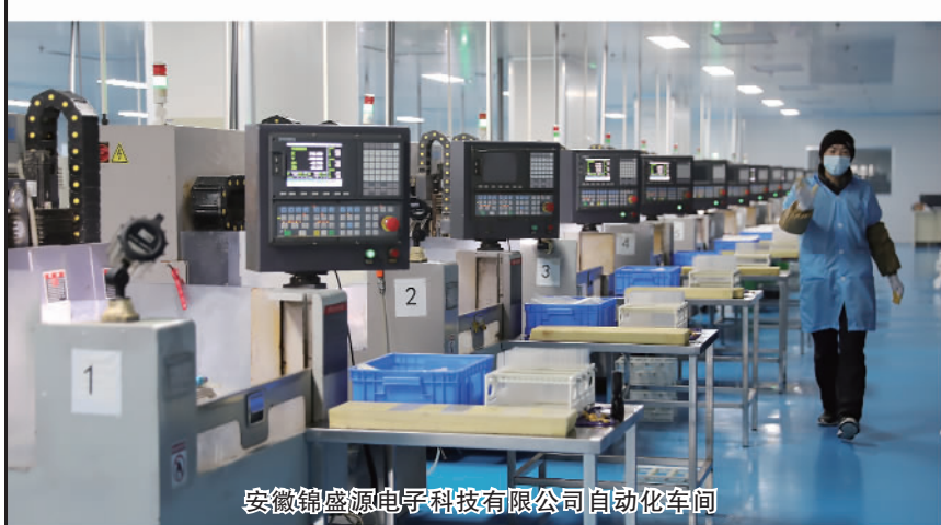
安徽锦盛源电子科技有限公司自动化车间