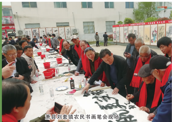
萧县刘套镇农民书画笔会现场