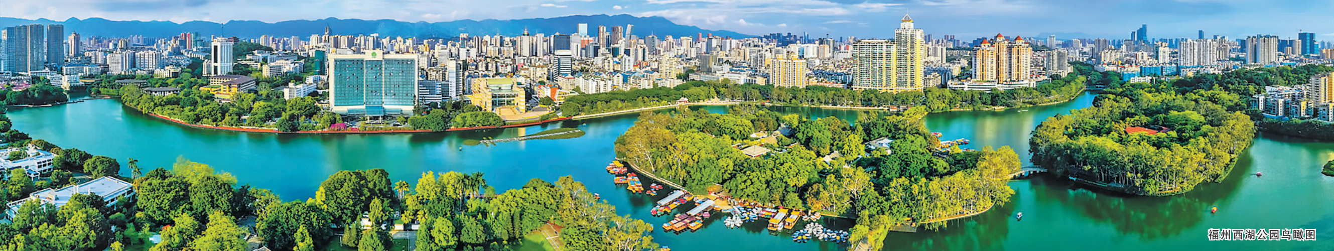
福州西湖公园鸟瞰图