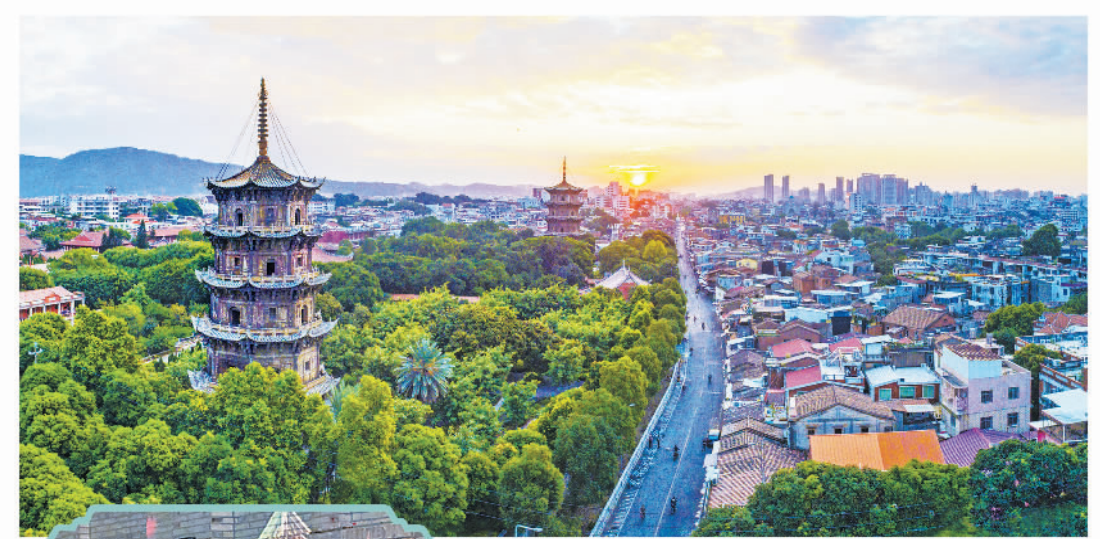
开元寺东西塔。7月25日，“泉州：宋元中国的世界海洋商贸中心”被列入《世界遗产名录》