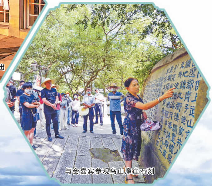
与会嘉宾参观乌山摩崖石刻