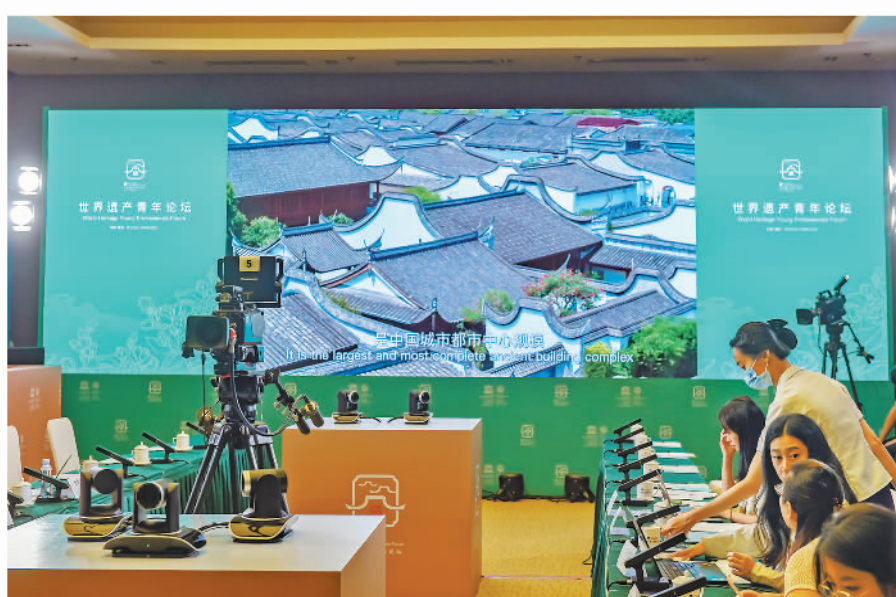
世界遗产青年论坛

第44届世界遗产大会于2021年7月16日至7月31日在福州举行。 本届大会采取线下加线上的办会方式，联合国教科文组织以在线形式审议了2020年和2021年两个年度的世界遗产项目，更新了世界遗产列表、濒危世界遗产列表、世界遗产预备名单列表3项重要列表。7月25日，“泉州：宋元中国的世界海洋商贸中心”经大会审议，成功列入《世界遗产名录》，成为我国第56处世界遗产。