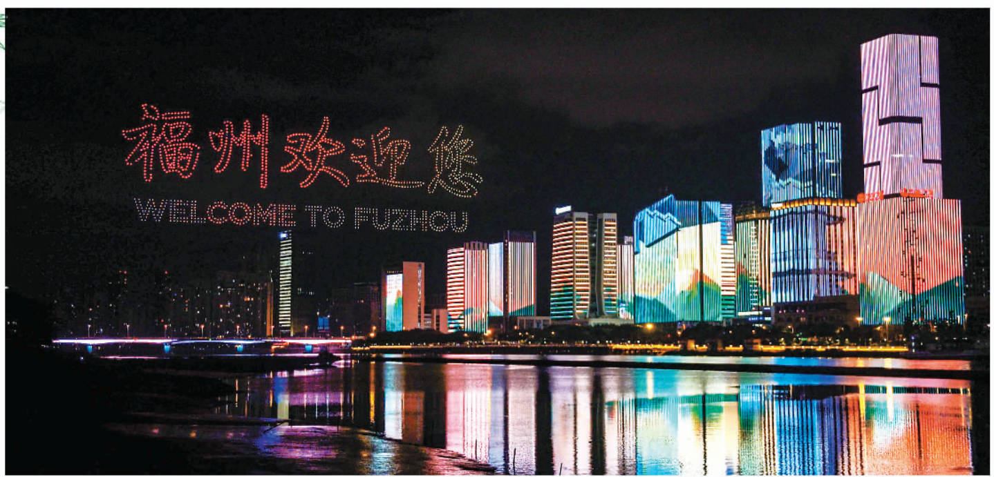
闽江畔上演灯光秀和无人机表演

福 44 th Session of the World Heritage Committee FUZHOU, CHINA 2021 第44届世界遗产大会