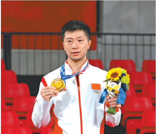
马龙在颁奖仪式上。