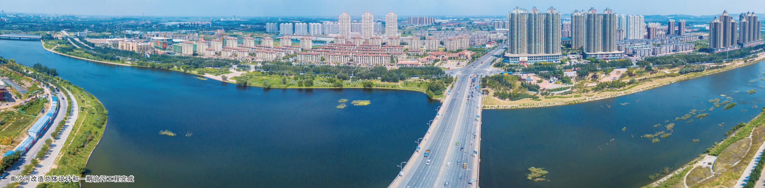
南沙河改造总体设计和一期治污工程完成