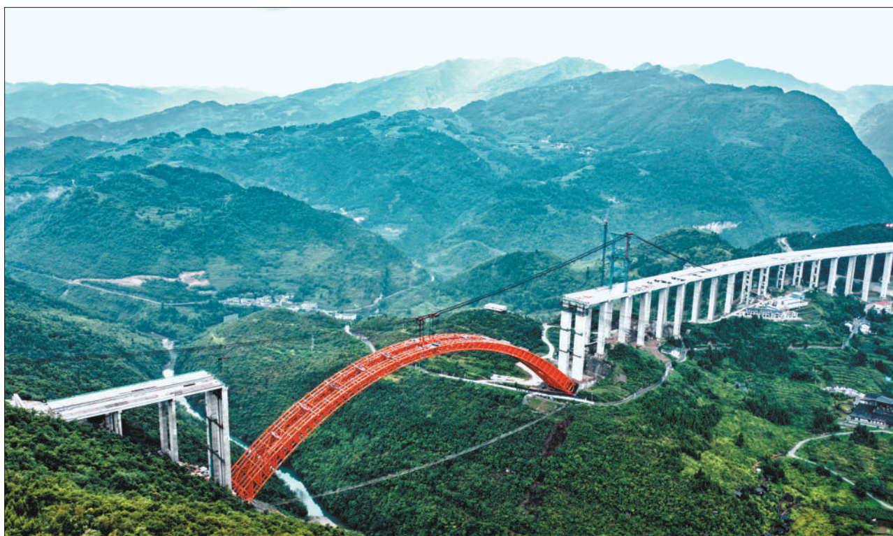
7月27日,贵州仁遵(仁怀至遵义)高速大发渠特大桥主拱顺利合龙。

坚持习近平新时代中国特色社会主义思想,必须坚持党领导下的政治制度优势,必须坚持全国公安“一盘棋”思想,必须坚持精益求精和全身心投入,必须坚持自我革命锻造过硬队伍。要深入总结安保维稳工作的经验,把强烈的爱党爱国爱社会主义热情转化为护航新征程、建功新时代的强大动力,坚决捍卫国家政治安全,着力防范化解重大涉稳风险,全面加强公共安全管理,认真抓好公安队伍教育整顿,扎实抓好防风险、保安全、护稳定各项措施的落实。