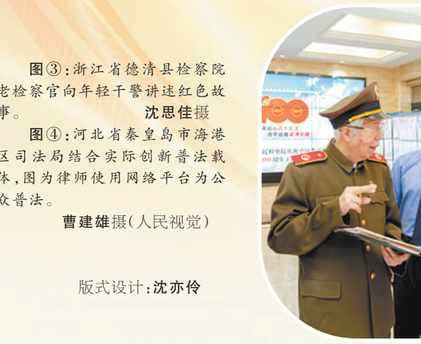
图③：浙江省德清县检察院老检察官向年轻干警讲述红色故事。