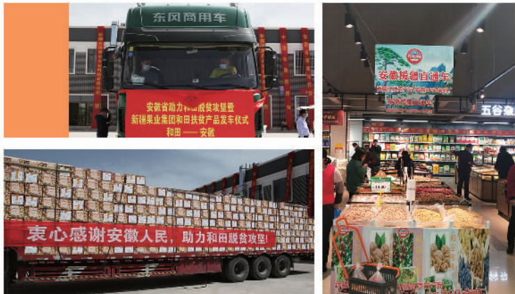
新疆优质农产品安徽援疆直通车

自2010年开始,安徽省对口支援和田地区皮山县,累计拨付援疆资金37亿多元,实施援建项目380余个,引进800多名教育、科技、农业等专业技术人才,精准实施各项帮扶措施,助力皮山打赢脱贫攻坚战。2020年以来,安徽援疆指挥部认真贯彻落实第三次中央新疆工作座谈会、第七次全国对口支援新疆工作会议精神,在两地省委、省政府的领导下,把握新发展阶段,贯彻新发展理念,结合受援地实际,奏响“消费帮扶、标注就业、智慧教育”对口支援三部曲,助推皮山高质量发展。