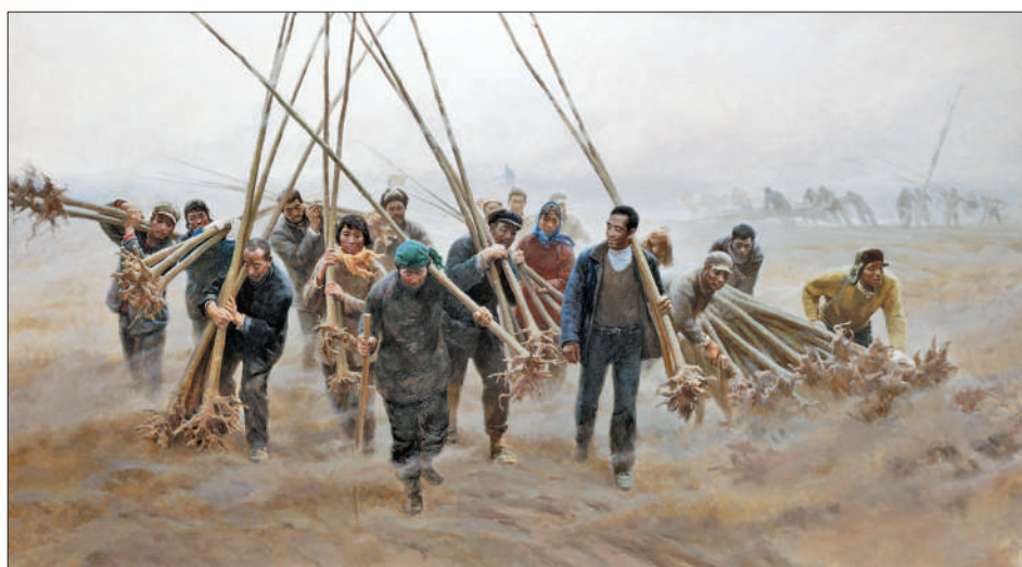
▲焦裕禄(油画) 毛本华 王刚 鲍璐 郝来嘉 ▼逐梦(雕塑) 焦兴涛 ▼孔繁森(雕塑) 吴为山