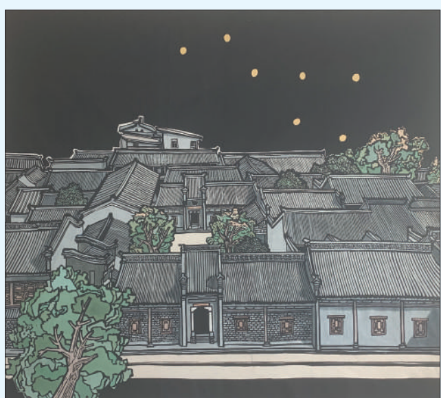
►鄂豫皖苏维埃政府税务总局旧址(版画)