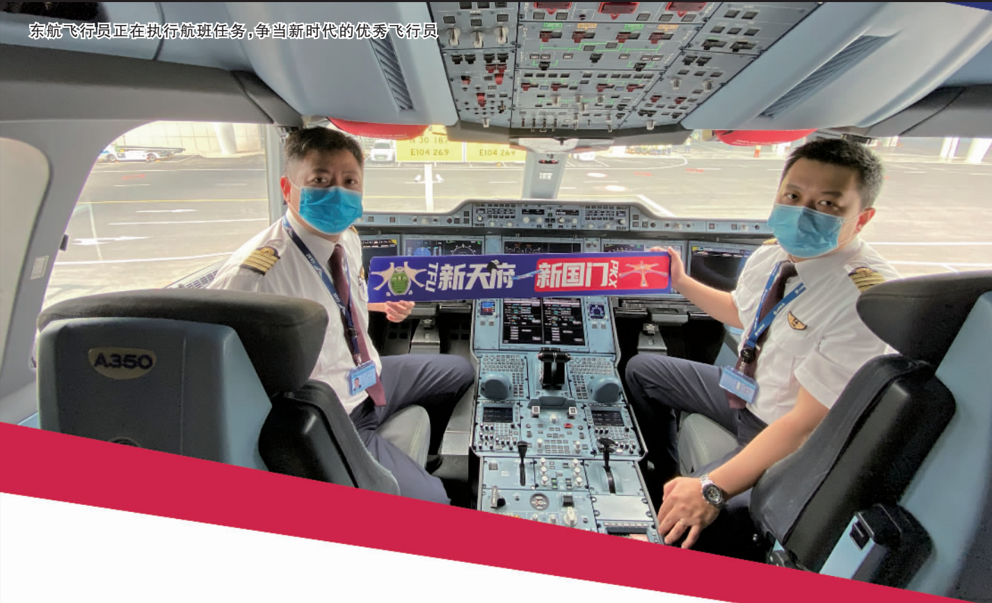
东航飞行员正在执行航班任务,争当新时代的优秀飞行员