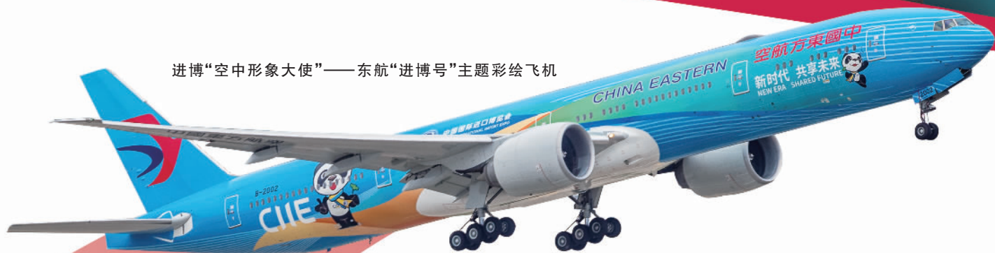
进博“空中形象大使”——东航“进博号”主题彩绘飞机