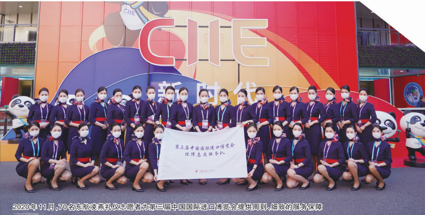
2020年11月,70名东航凌燕礼仪志愿者为第三届中国国际进口博览会提供周到、细致的服务保障