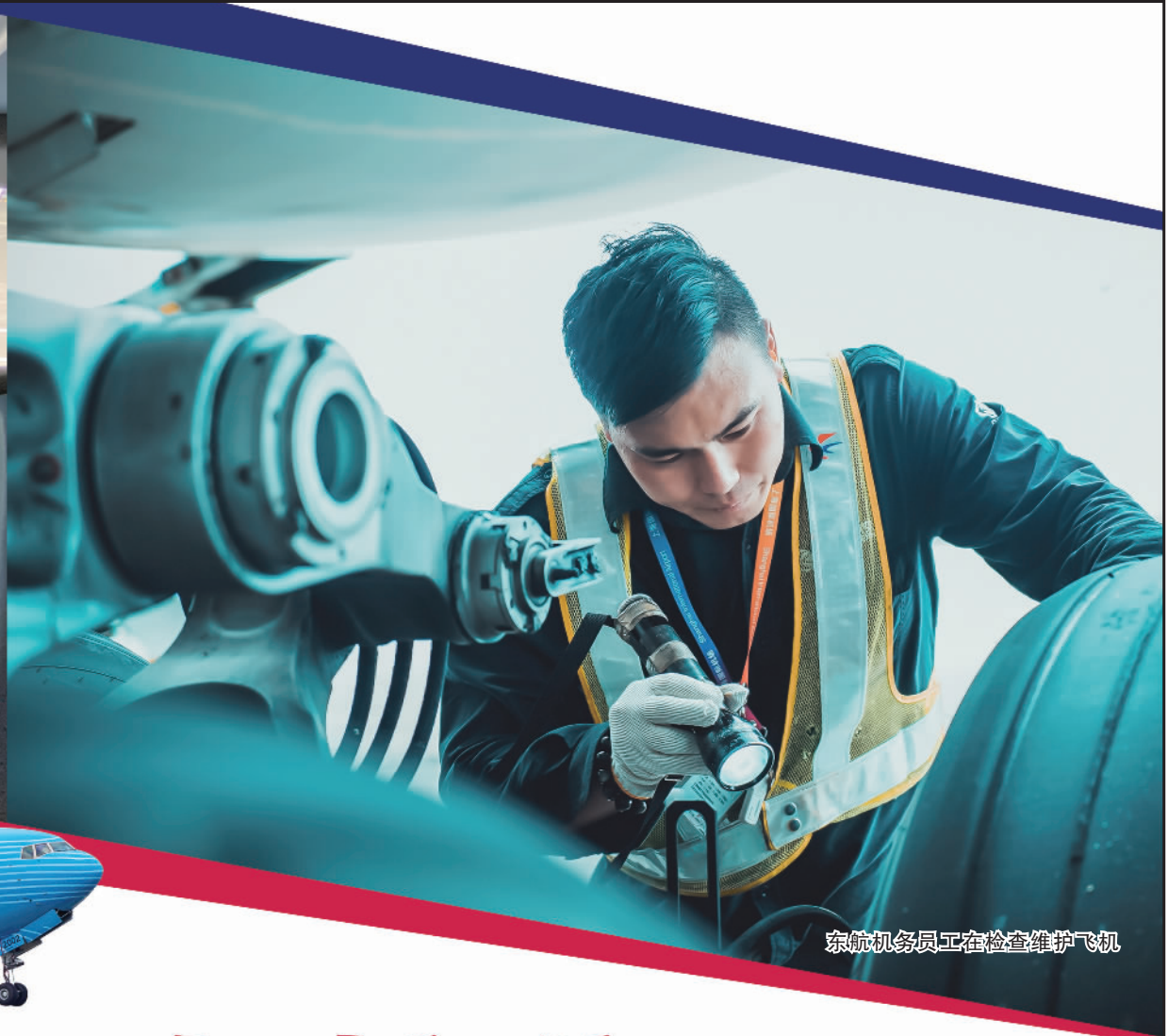
东航机务员工在检查维护飞机