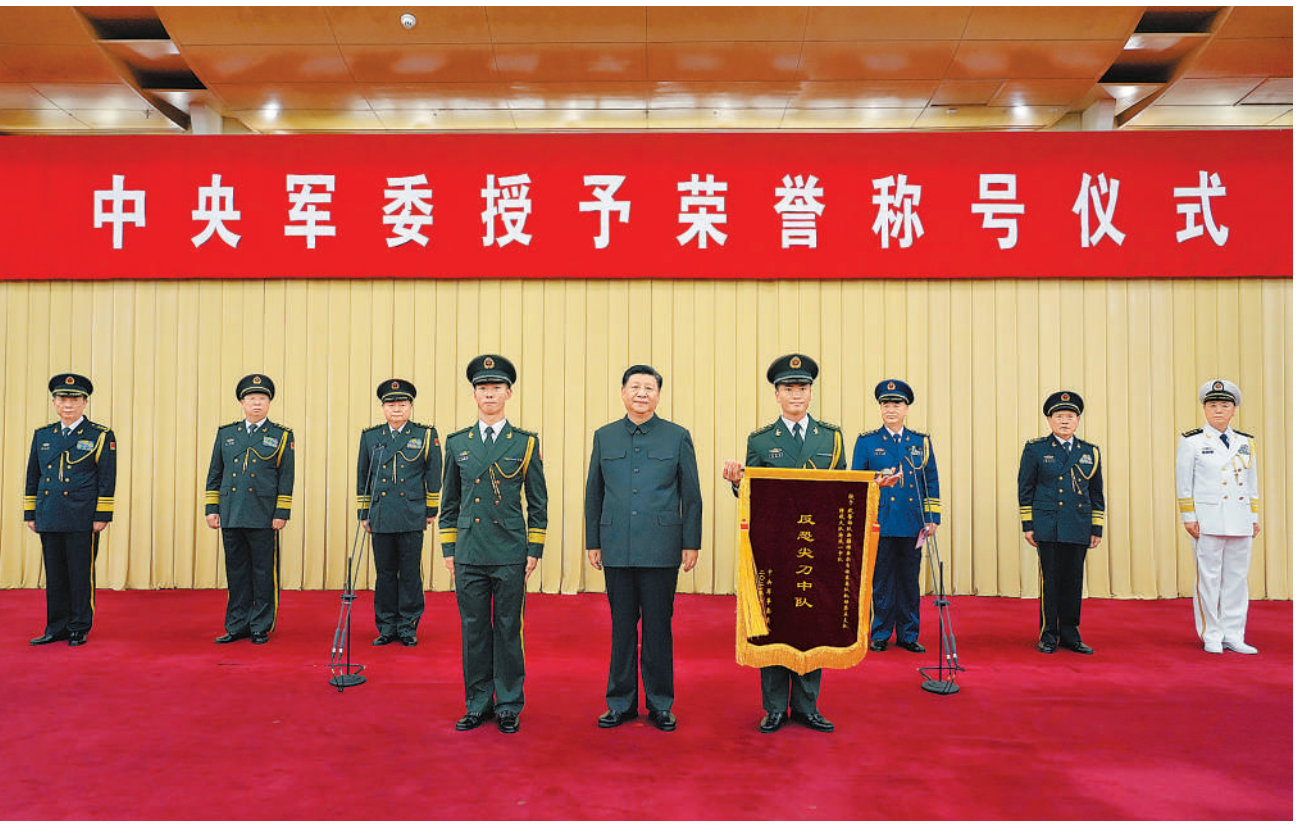
7月5日，中央军委授予荣誉称号仪式在北京隆重举行。中央军委主席习近平向获得“反恐尖刀中队”荣誉称号的武警部队新疆维吾尔自治区总队某机动支队特战大队特战1中队颁授奖旗，并同该中队代表合影留念。