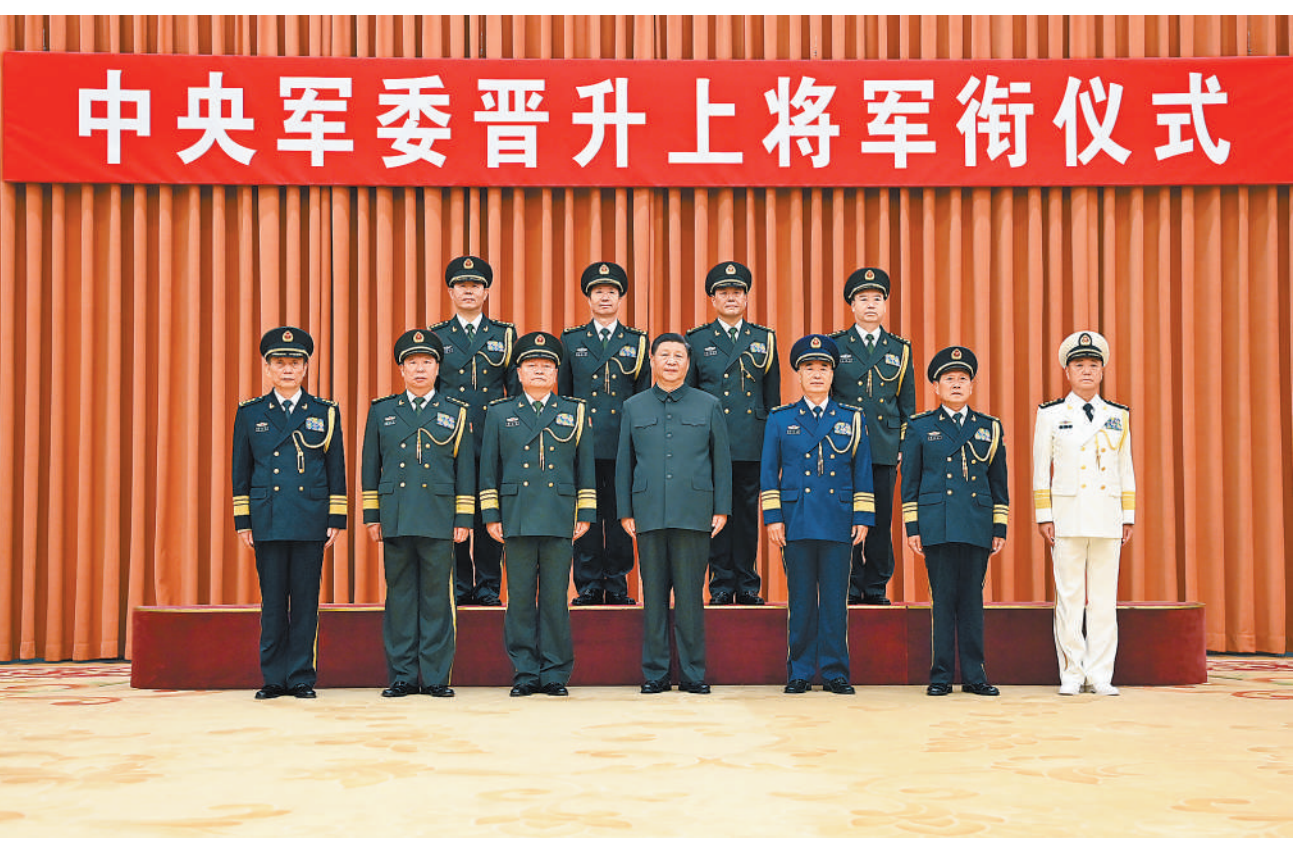
7月5日，中央军委晋升上将军衔仪式在北京八一大楼隆重举行。中央军委主席习近平向晋升上将军衔的军官颁发命令状。这是习近平等领导同志同晋升上将军衔的军官合影。