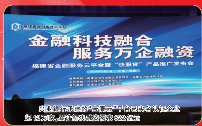
兴业银行承建的“金服云”平台已实名认证企业超12万家,累计解决融资需求622亿元