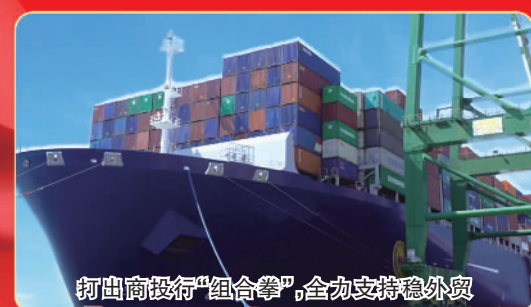
打出商行“组合拳”,全力支持稳外贸