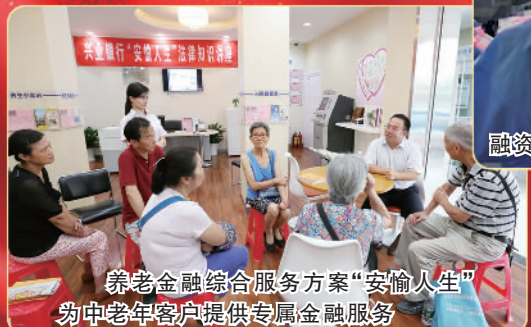
养老金综合服务方案“安愉人生”为中老年客户提供专属金融服务