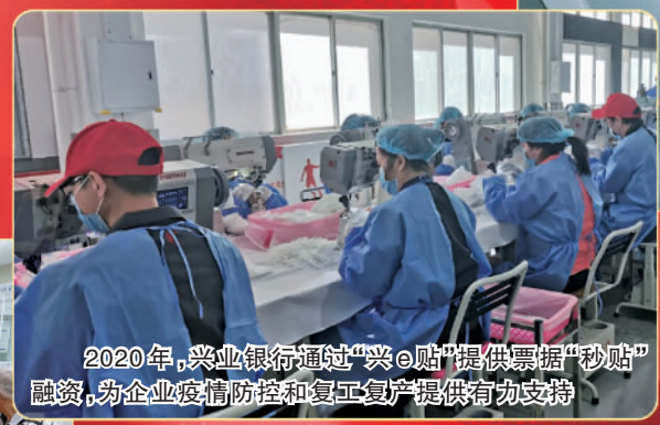
2020年,兴业银行通过“兴e贴”提供票据“秒贴”融资,为企业疫情防控和复工复产提供有力支持