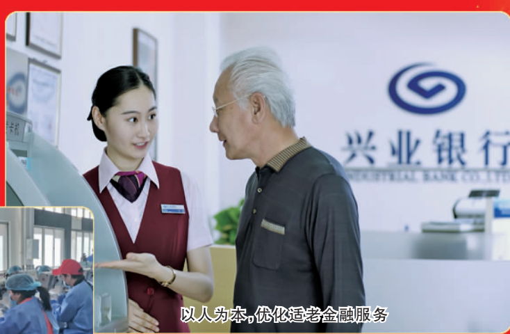
以人为本,优化适老金融服务