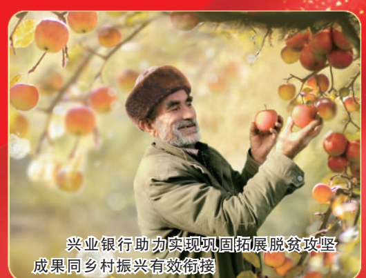
兴业银行助力实现巩固拓展脱贫攻坚成果同乡村振兴有效衔接