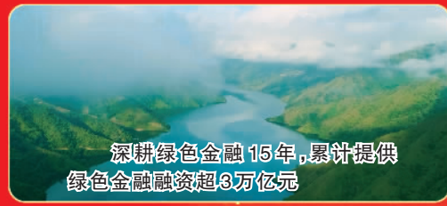
深耕绿色金融15年,累计提供绿色金融融资超3万亿元