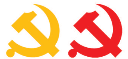
党徽图案标准版色度值：黄色 R=253 G=207 B=48 红色 R=237 G=44 B=37