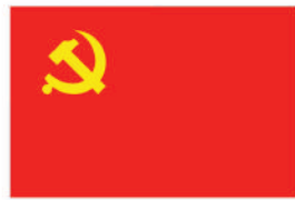
党旗图案标准版色度值：黄色 R=255 G=255 B=0 红色 R=238 G=28 B=37

2. 画旗面长与宽中线将旗分成4等分的长方形，左上方长方形内划出横18竖12等分的小方格。