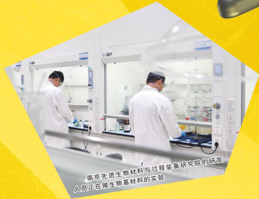
南京先进生物材料与过程装备研究院的研发人员正在做生物基材料的实验