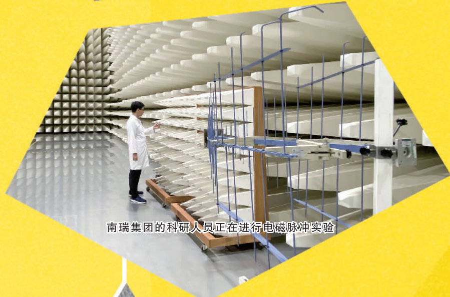
南瑞集团的科研人员正在进行电磁脉冲实验