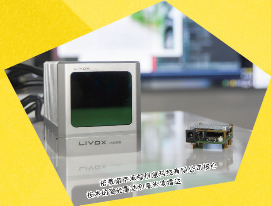
搭载南京承邮信息科技有限公司核心技术的激光雷达和毫米波雷达