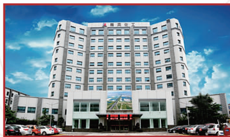
山西焦煤运城盐化集团有限责任公司 旗南风化工大楼