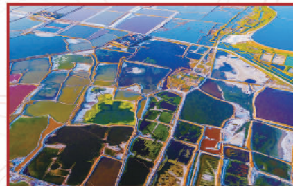
山西运城盐湖俯拍