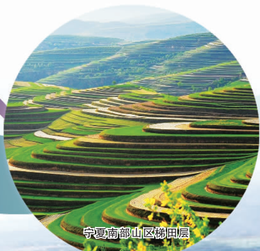
宁夏南部山区梯田层