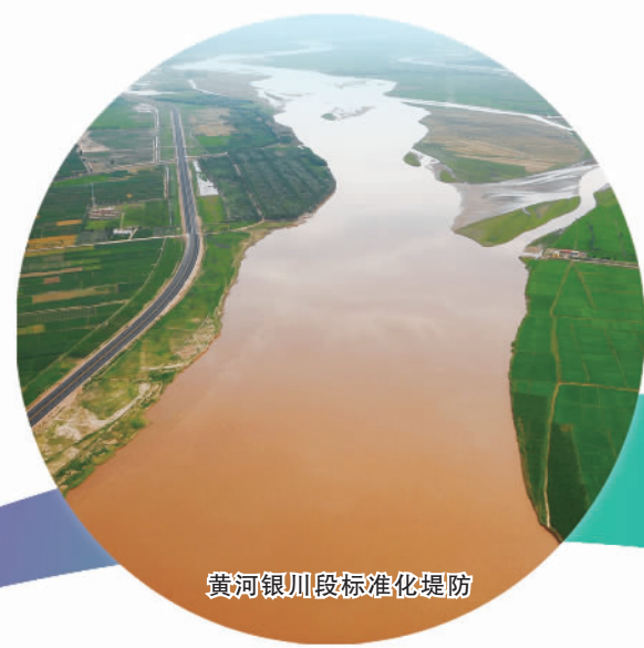
黄河银川段标准化堤防