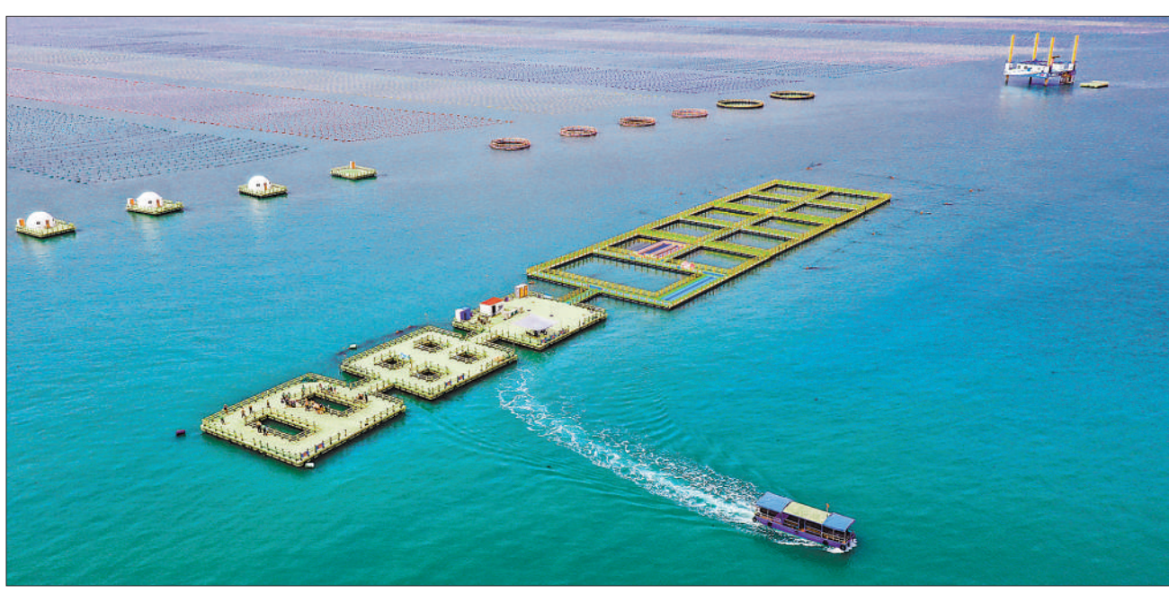
6月8日是第十三个“世界海洋日”和第十四个“全国海洋宣传日”。我国探索建立沿海、流域、海域协同一体的综合治理体系，打造可持续海洋生态环境，促进人与自然和谐共生。图为6月8日，生态优美的山东省荣成市爱伦湾海洋牧场海上观光平台。