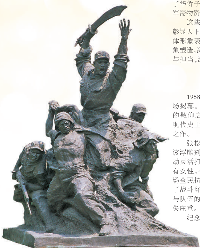
▲潘鹤、梁明诚雕塑《大刀进行曲》。

14年的抗战史,充分彰显了以爱国主义为核心的伟大民族精神。弘扬伟大民族精神,成为抗战题材美术创作的重要表现内容。《大刀进行曲》《黄河大