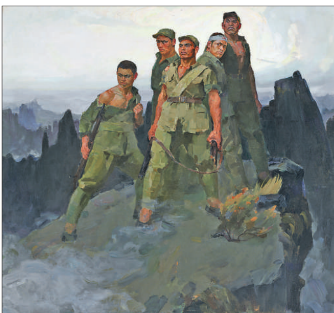
▼詹建俊油画《狼牙山五壮士》。